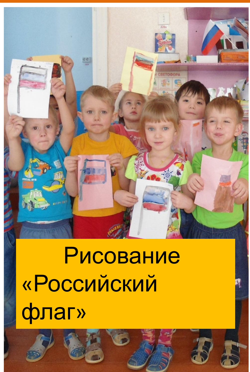
Рисование «Российский флаг»