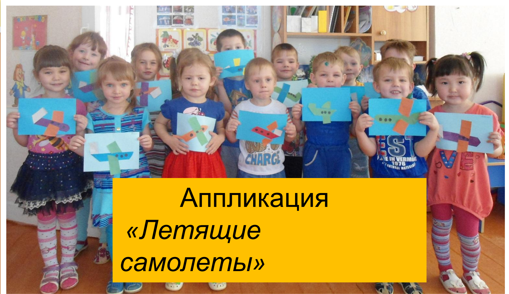
Аппликация «Летящие самолеты»