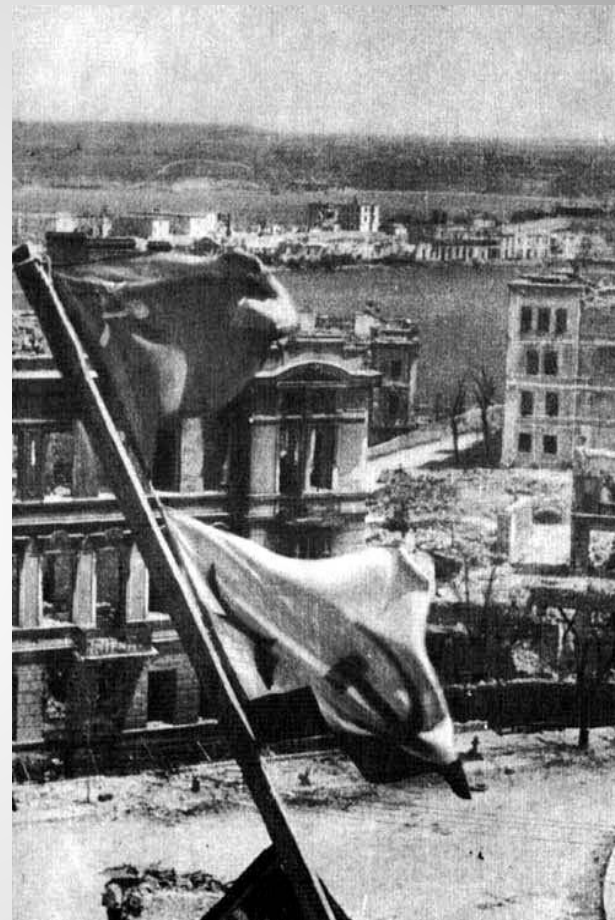
Над руинами города взвились Красные флаги победы. Севастополь, 1944 год

9 мая 1944 к вечеру был полностью освобожден Севастополь, 10 мая в час ночи Москва 24 залпами из 342 орудий салютовала освободителям города. В этот день газета "Правда" писала: "Здравствуй, родной Севастополь! Любимый город советского народа, город-герой, город-богатырь! Радостно приветствует тебя вся страна!". 12 мая в районе мыса Херсонес были разгромлены остатки фашистских войск в Крыму.