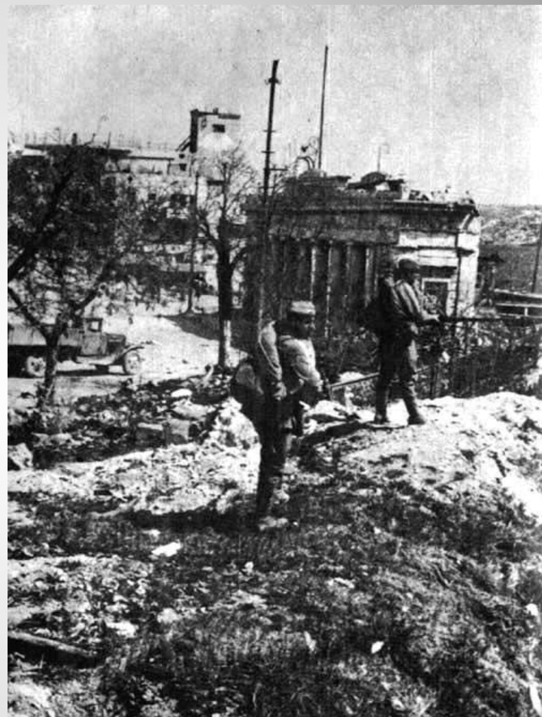
В городе тишина. Севастополь, 1944 год

Несмотря на жесточайший оккупационный режим, севастопольцы не прекратили борьбу с фашистами.