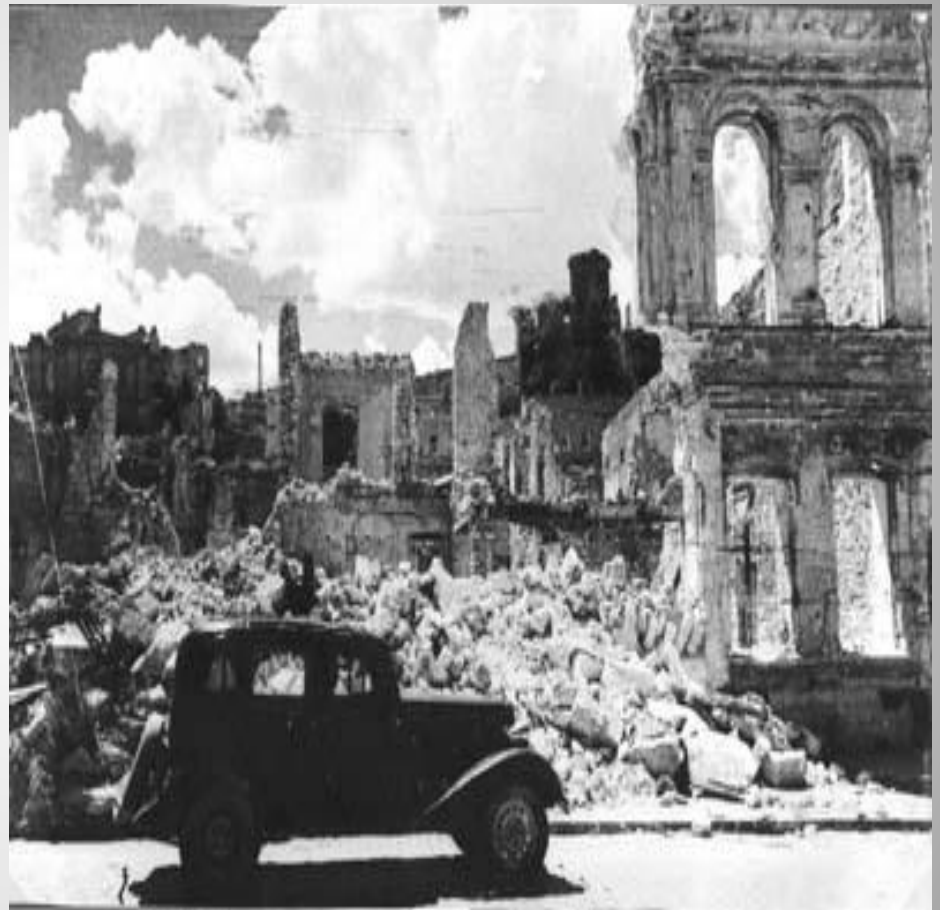
В разрушенном Севастополе 1944 года.

Защитников города постоянно поддерживали корабли флота. Прорываясь в осажденный Севастополь, они доставляли пополнения, боеприпасы, продукты питания, увозили на Большую землю раненых, стариков, женщин и детей, вели артиллерийский огонь по позициям врага. А когда надводные корабли уже не могли прорываться к Севастополю, их задачу отважно выполняли экипажи подводных лодок. Несгибаемое мужество и само отверженность проявили в дни обороны медицинские работники флота и города. За 8 месяцев обороны они спасли жизни десяткам тысяч людей, возвратили в строй 30927 раненых и 10686 больных.