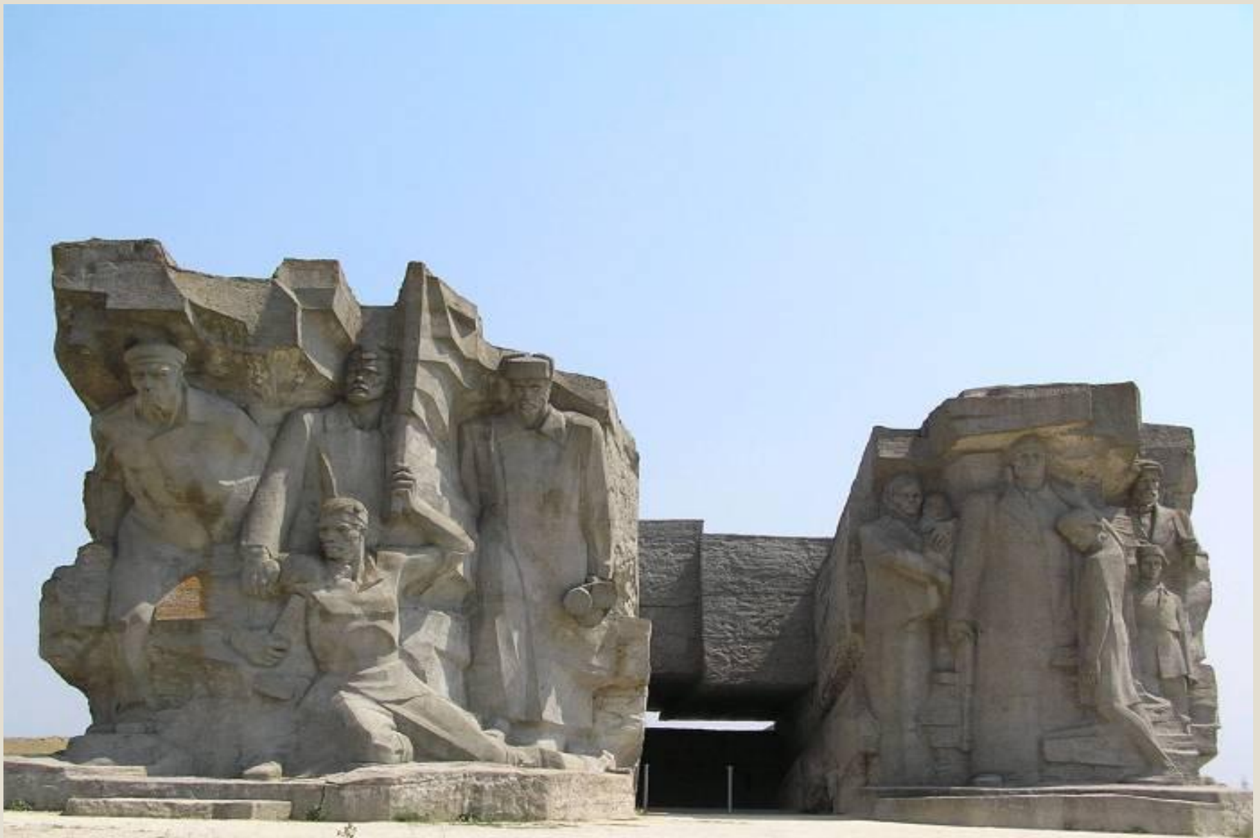
Музейный комплекс в каменоломнях Аджимушкая