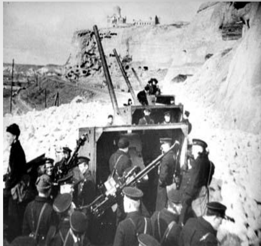
Бронепоезд выходит на позицию. 1942 год

В дни обороны жители города проявили ратный и трудовой героизм. Рабочие Морского завода под обстрелом врага ремонтировали корабли, создавали боевую технику днем и ночью, оборудовали два бронепоезда, построили и оснастили плавучую батарею № 3, получившую название "Не тронь меня", которая надежно прикрывала город от налетов фашистской авиации с моря. Немцы называли ее "Квадрат смерти". В горных выработках (штольнях) на берегу Севастопольской бухты были созданы подземные спецкомбинаты; № 1 - для производства вооружения и боеприпасов, № 2 - по пошиву белья, обуви и обмундирования. Тут же, под землей, работали амбулатории, столовая, клуб, школа, детские ясли и сад, а впоследствии - госпиталь, хлебозавод.