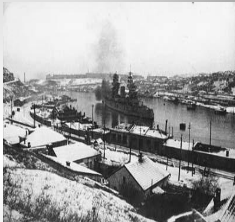
Линкор "Севастополь" ведет огонь по позициям врага из Южной бухты. 29 декабря 1941 года.