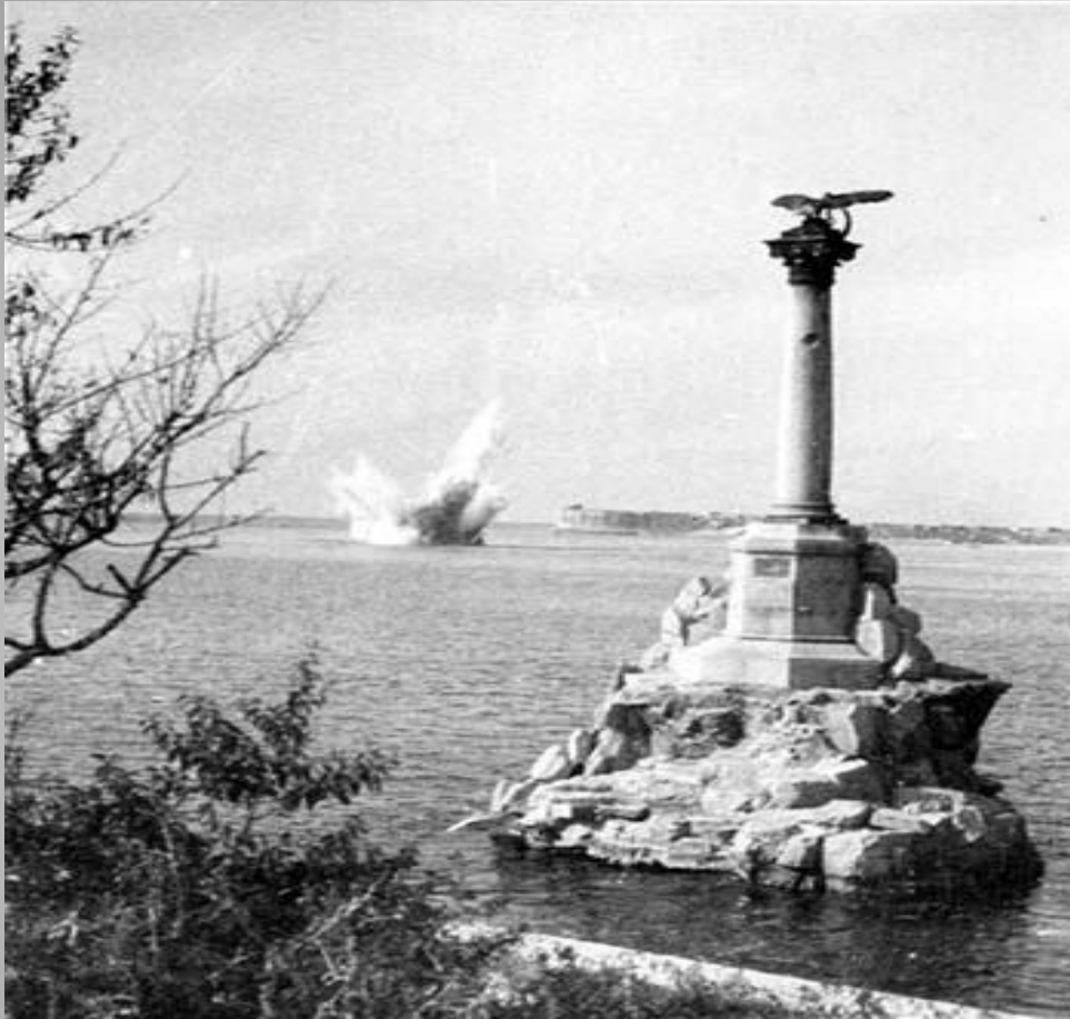
Взрыв немецкой мины на центральном рейде, 1941 год.

После провала попытки овладеть Севастополем с ходу немецко-фашистское командование осуществило три наступления на город: первое началось 11 ноября 1941 г., второе - 17 декабря 1941 г., третье - 7 июня 1942 г.