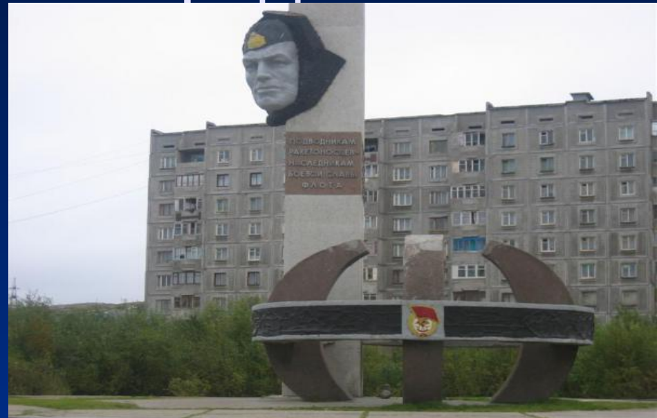
Монумент в честь уникальных походов 1971-1972 советскими ракетными подводными крейсерами стратегического назначения 667А проекта.