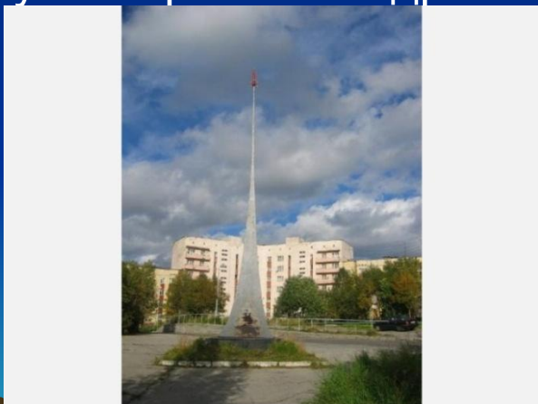
Монумент, посвященный началу космической эры.