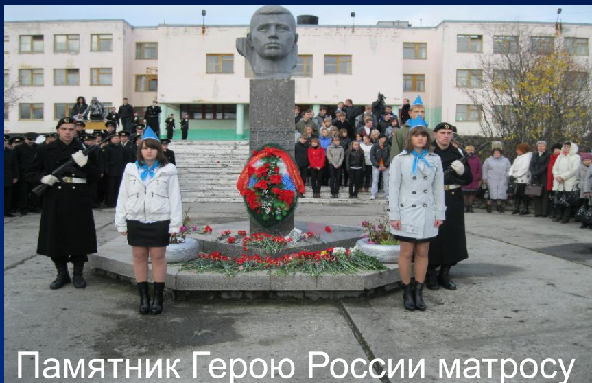
Памятник Герою России матросу Сергею Анатольевичу Премину (скульптор Александр Шебунин)