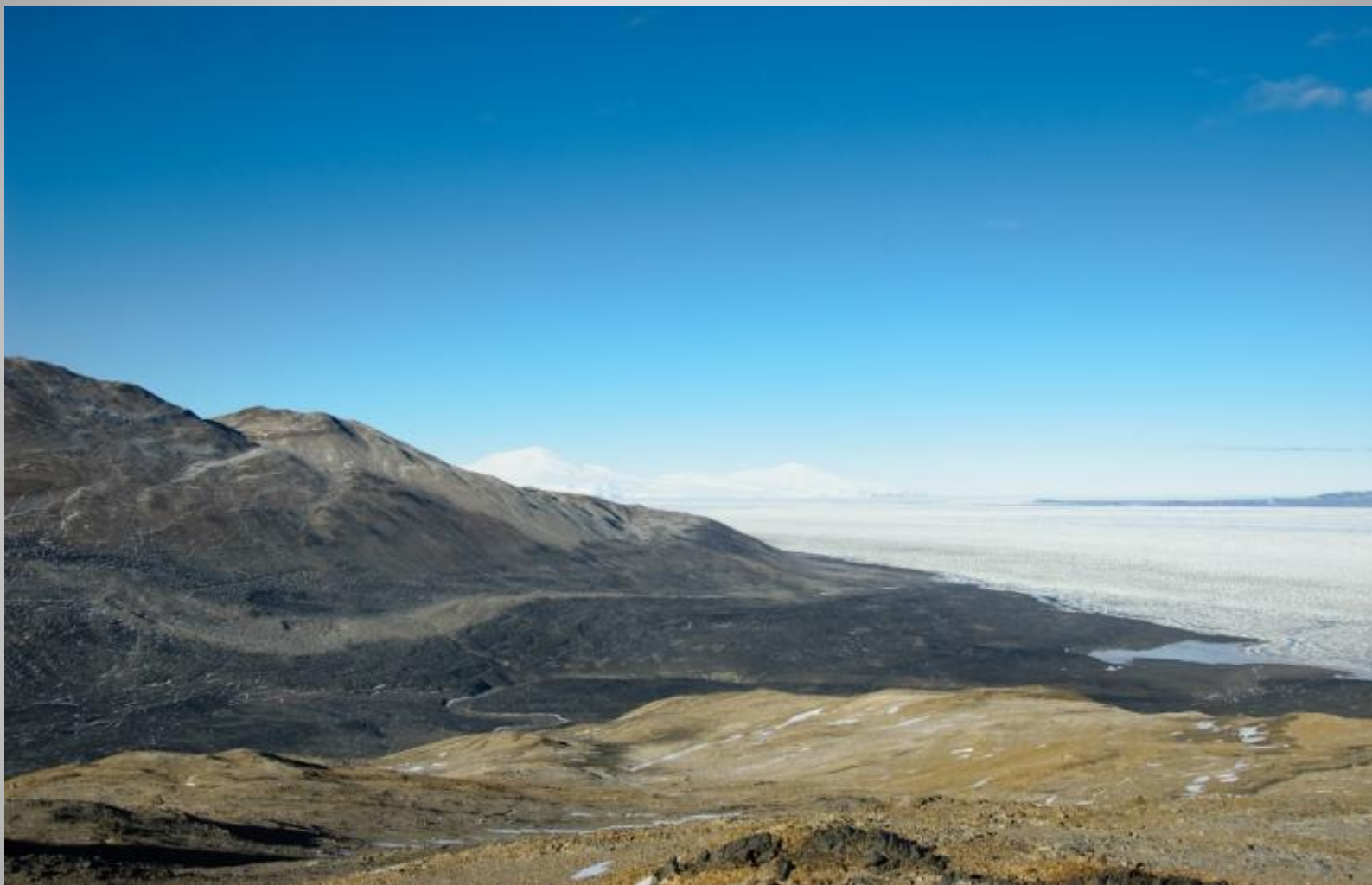
Сухие долины Мак-Мёрдо