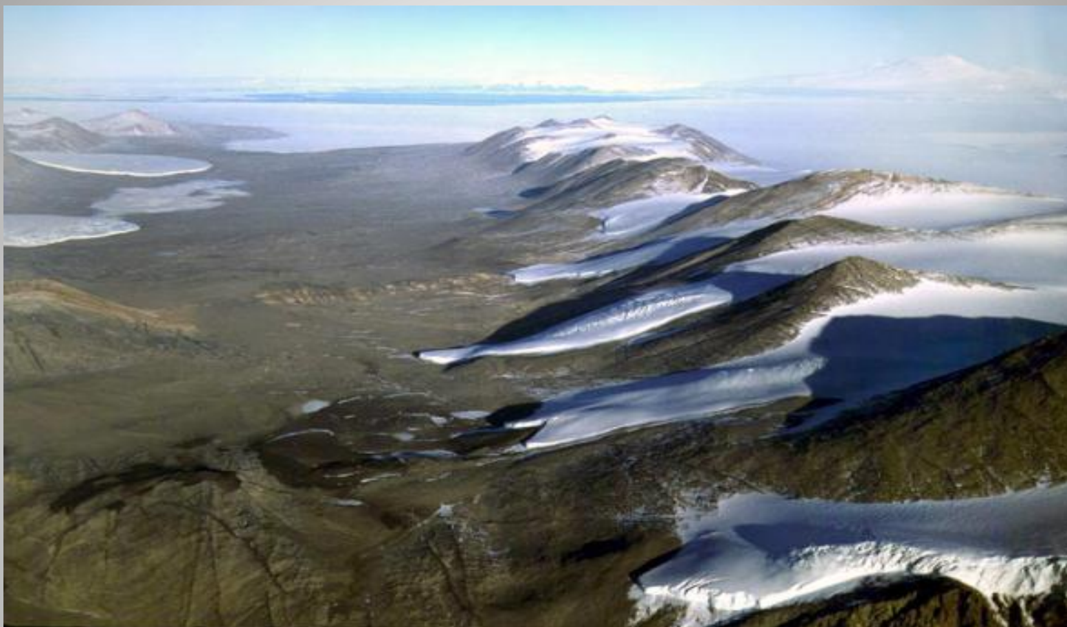
Сухие долины Мак-Мёрдо