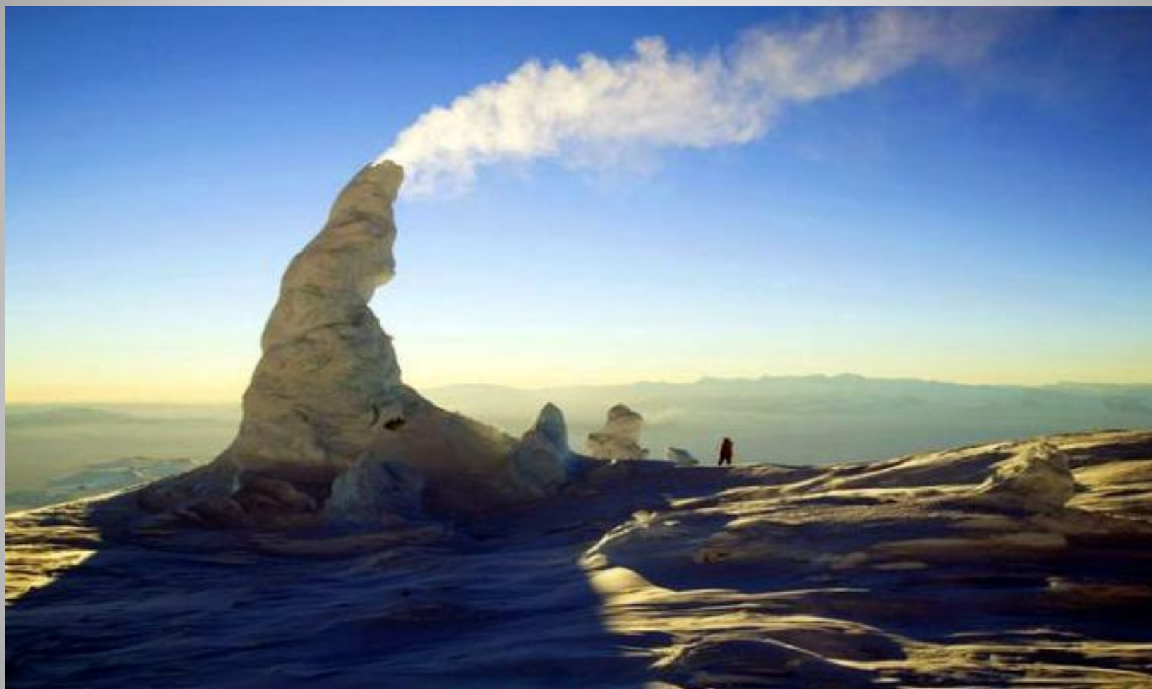
Вулкан Эребус на острове Росса