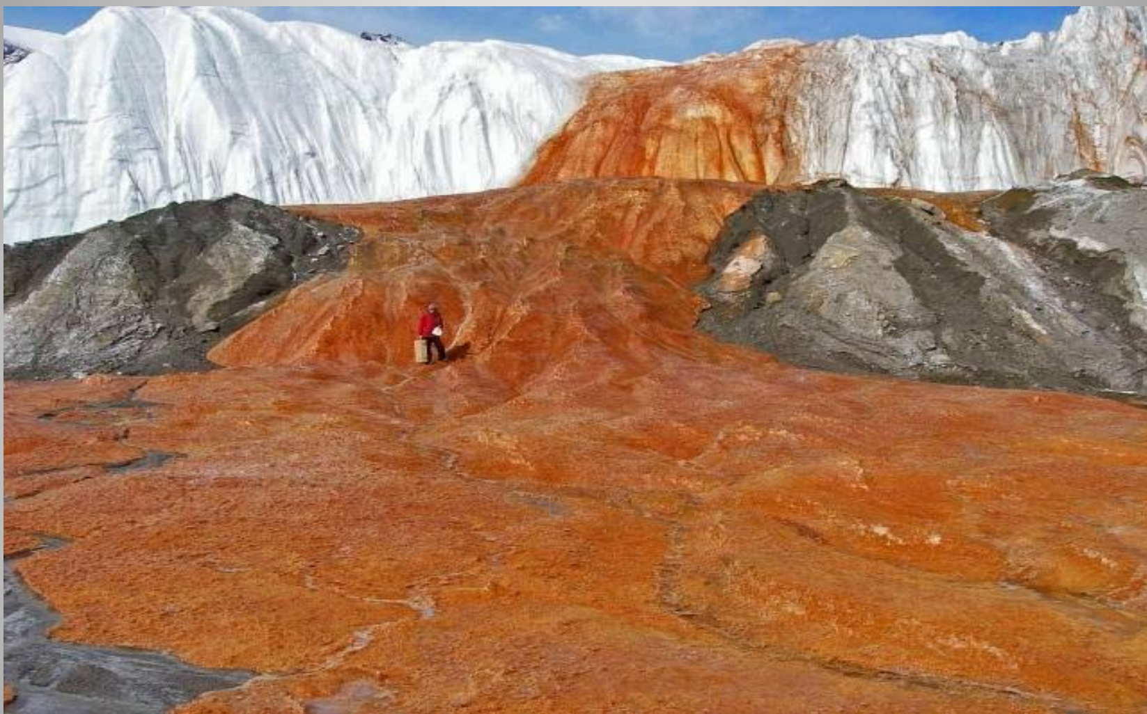
Кровавый водопад в Долине Тейлора