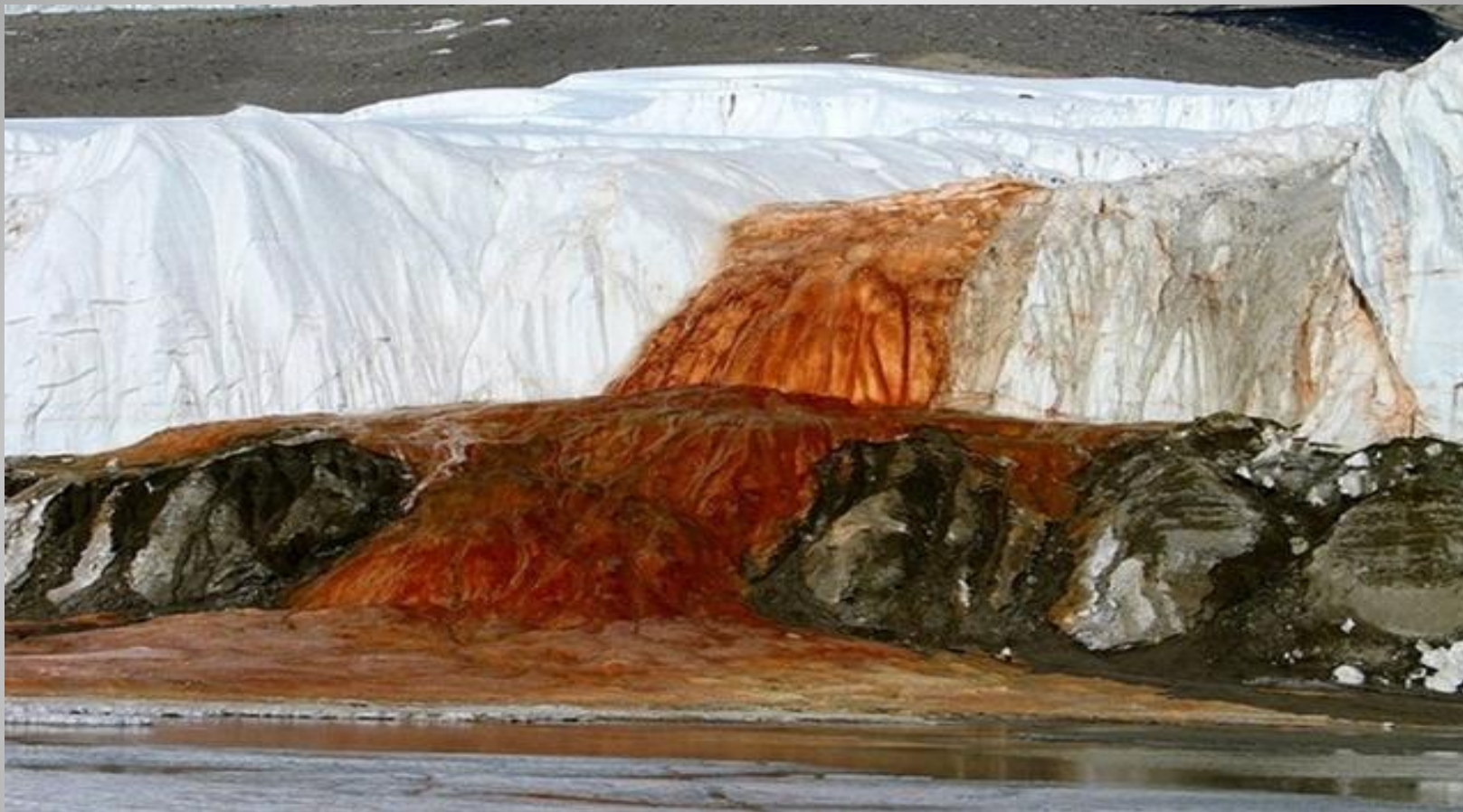
Кровавый водопад в Долине Тейлора