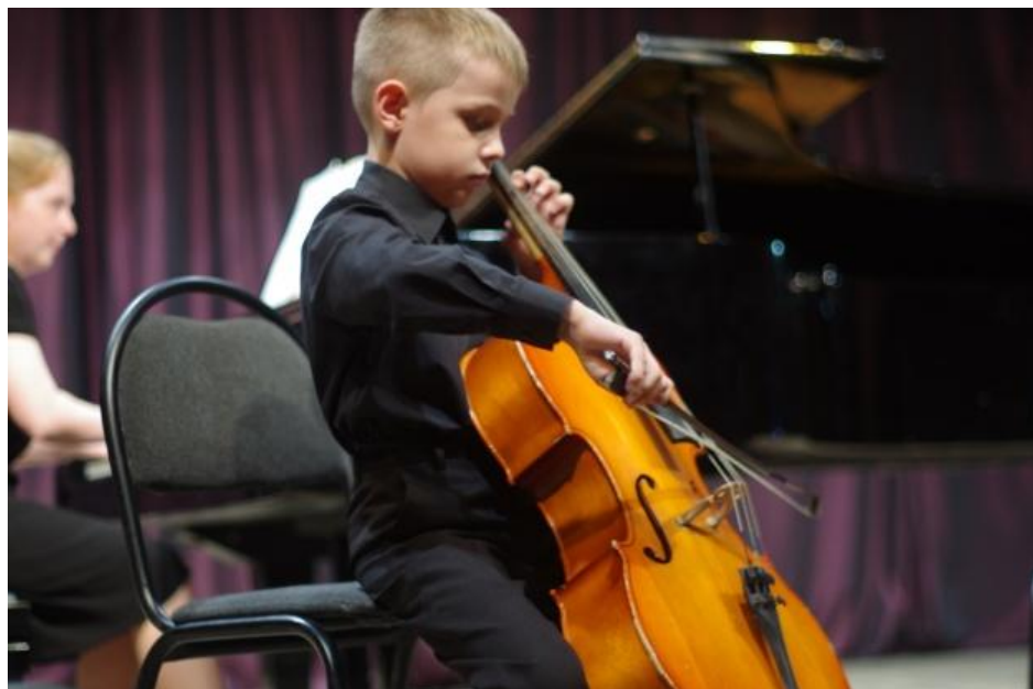
«Летняя музыкальная академия в городе Котлас»