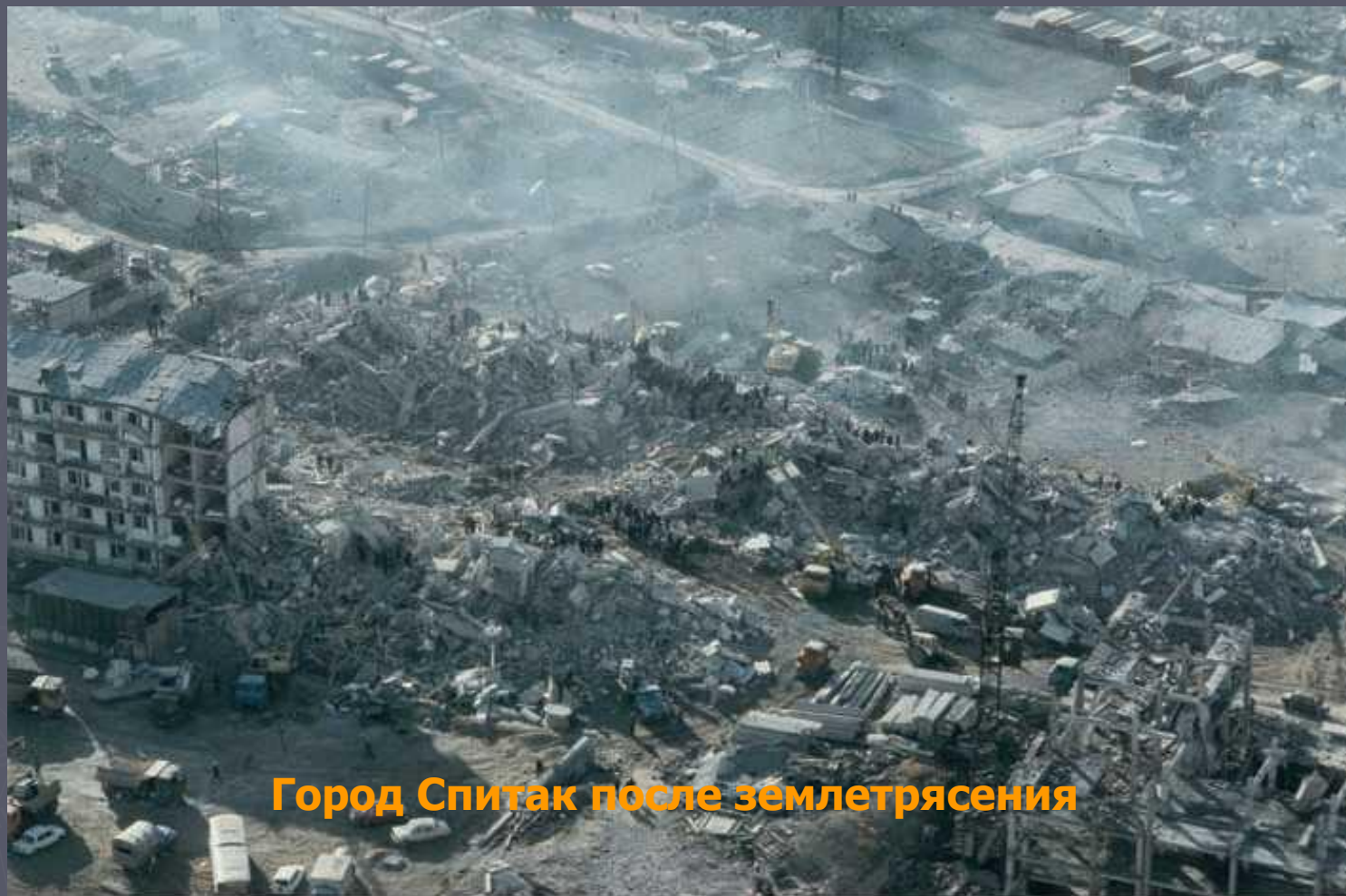
Город Спитак после землетрясения

Чрезвычайную ситуацию можно предвидеть, но чаще всего она возникает внезапно