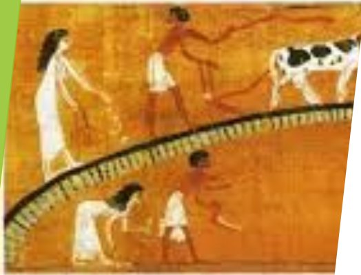
Полвека работы. Фрагмент египетской «Книги мёртвых».