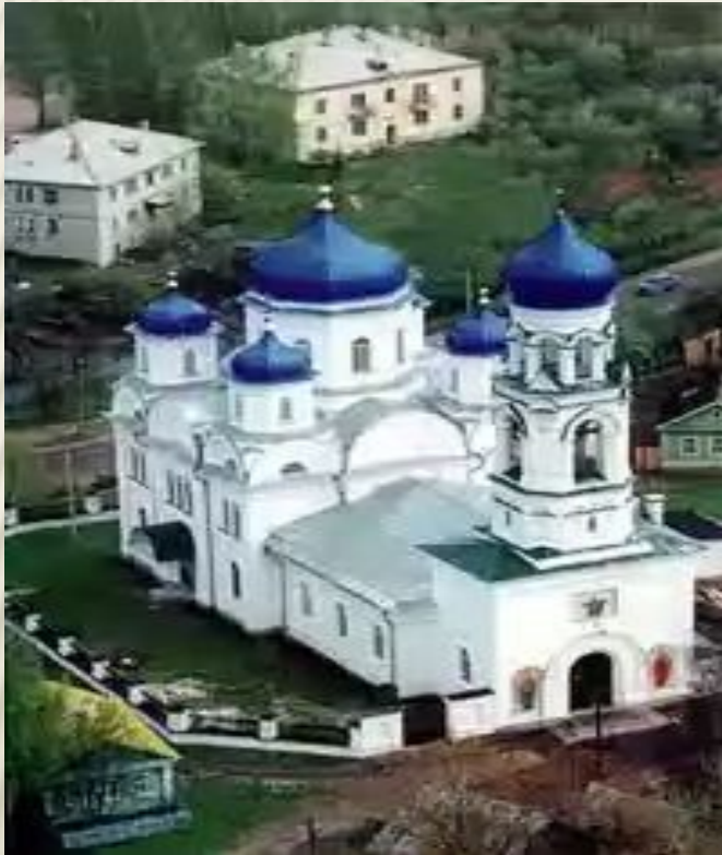
Церковь Архангела Михаила в Торжке