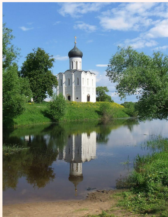
Церковь Покрова на Нерли