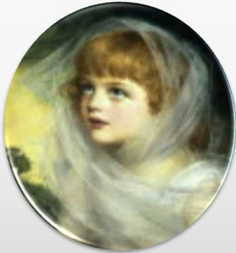
Детство (13 -15 лет)