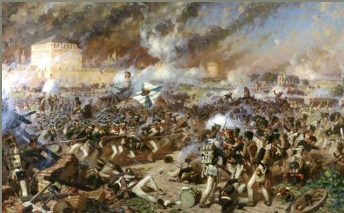
Сражение за Смоленск. Художник Аверьянов. 1995г.