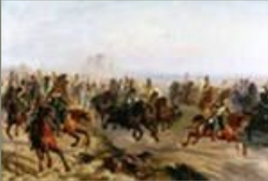
Рапорты русских военачальников о Бородинском сражении

В своих мемуарах впоследствии Н.Н. Муравьев вспоминал: