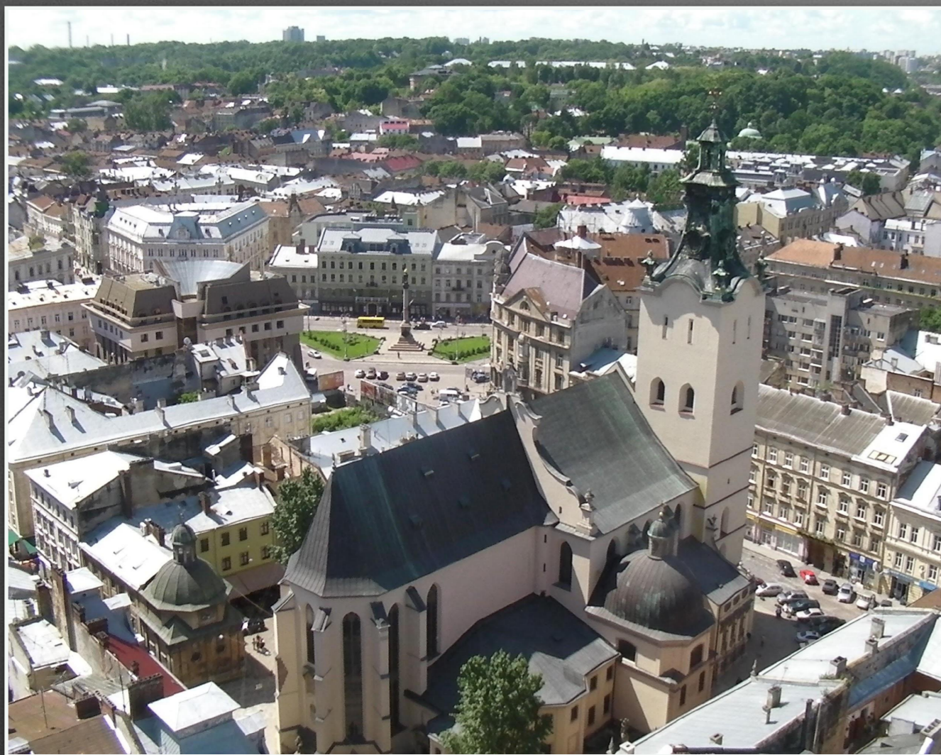
Львівський катедральний костел