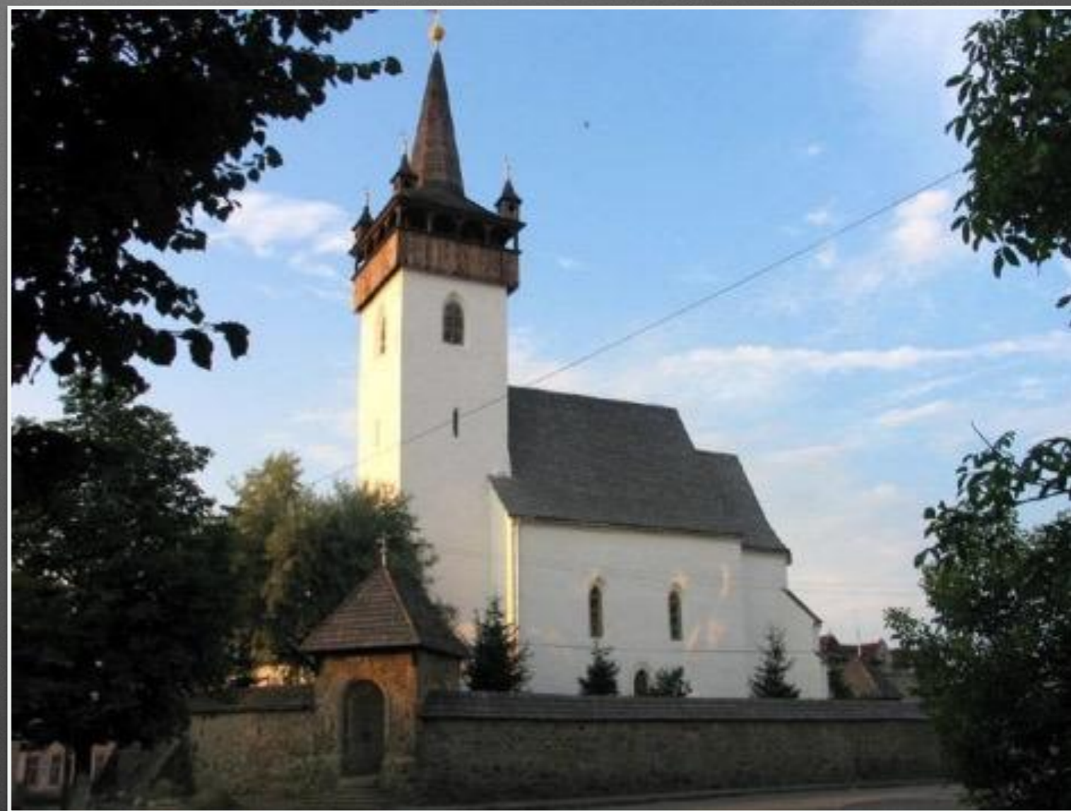
Костел Св. Єлизавети