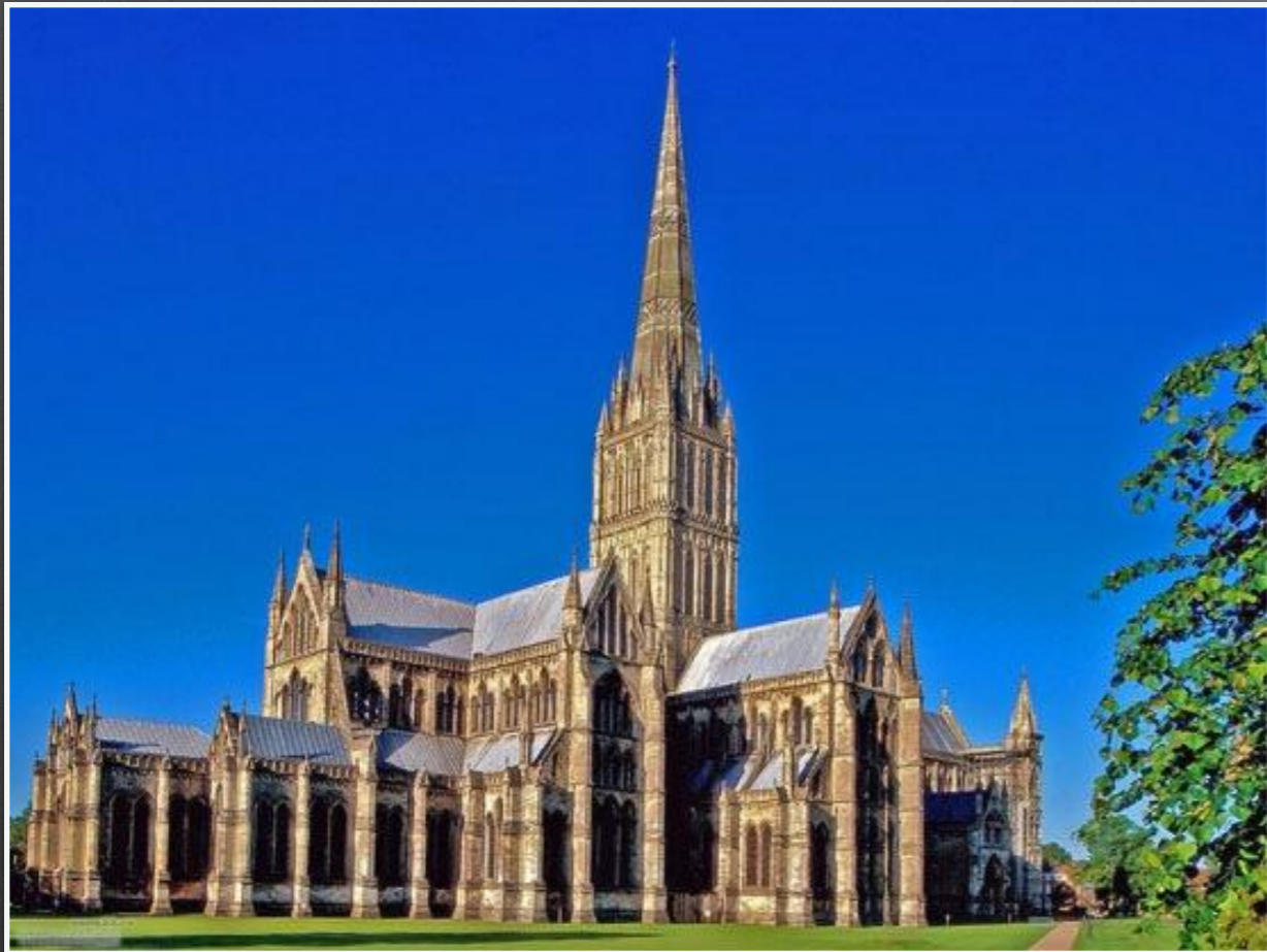
Собор у Солсбері