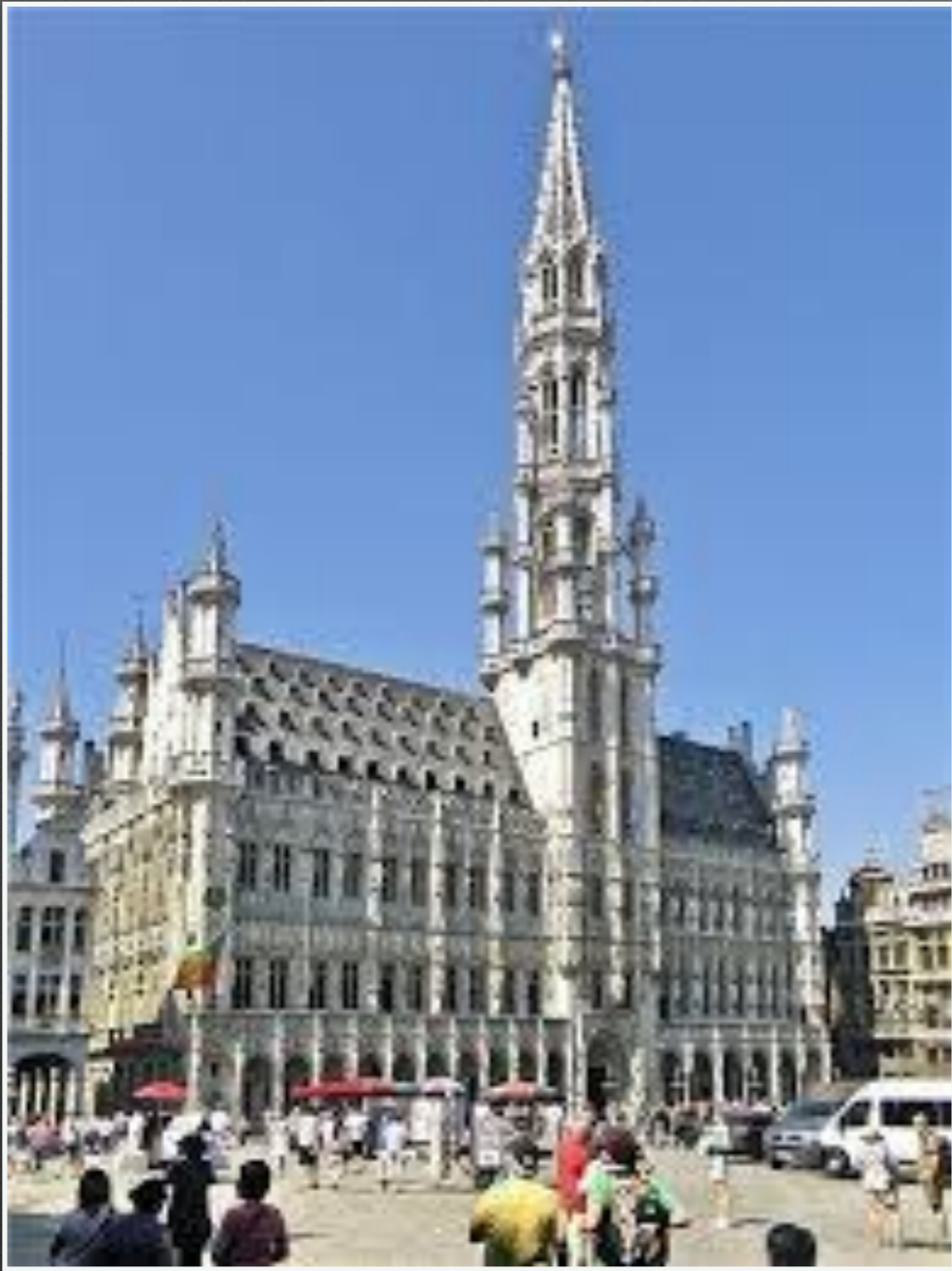
Ратуша в Брюсселі