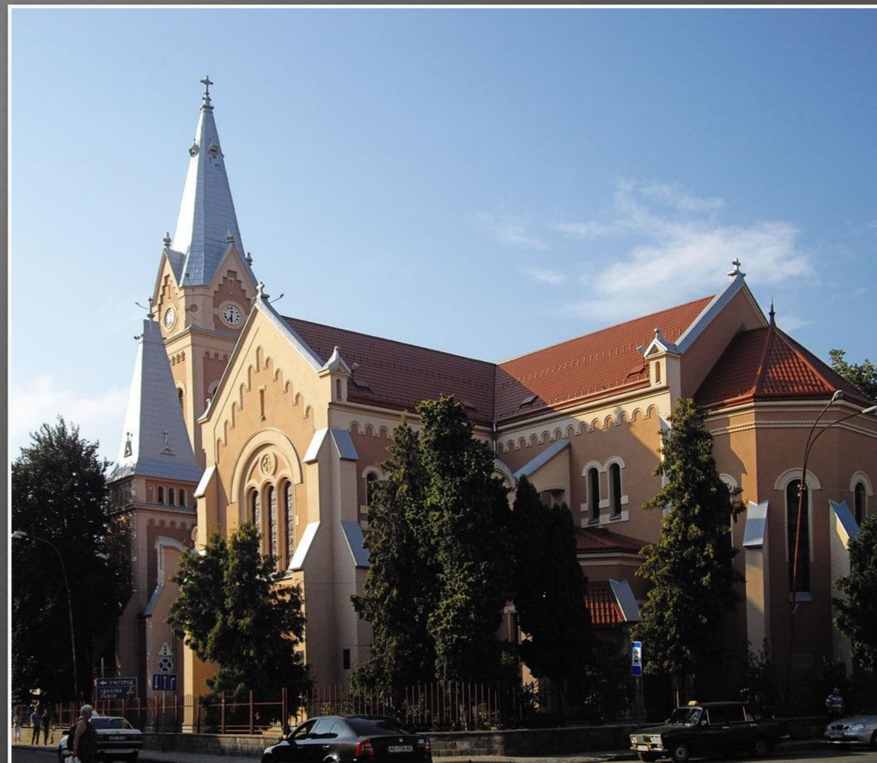
Церква Св. Мартина