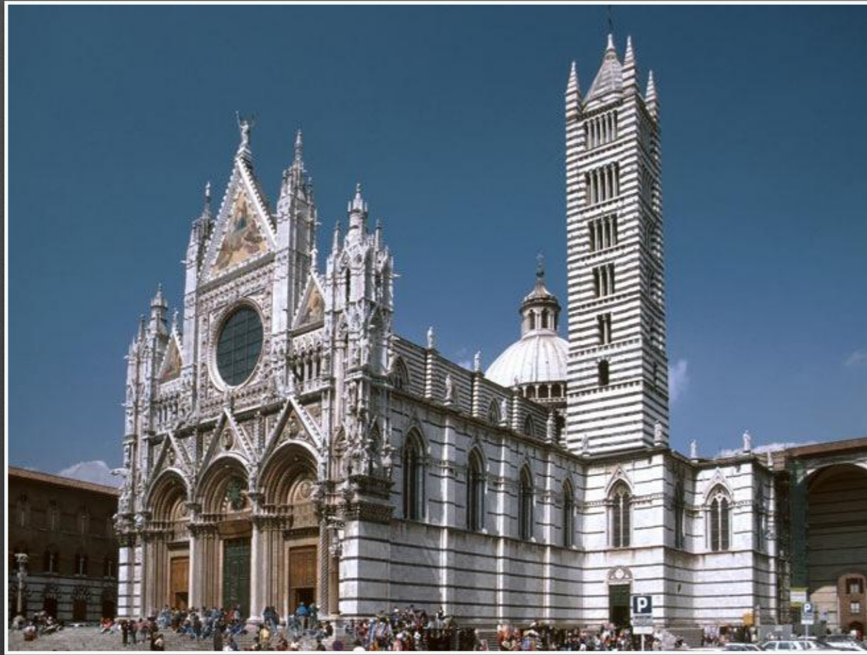
Собор у Сієні