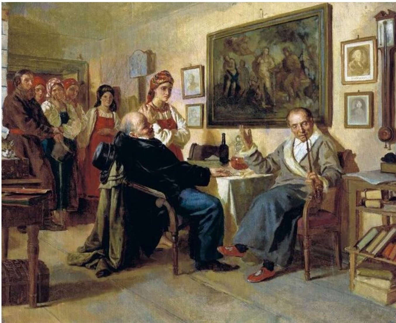
Николай Неврев Торг. Сцена из крепостного быта. Из недавнего прошлого, 1866