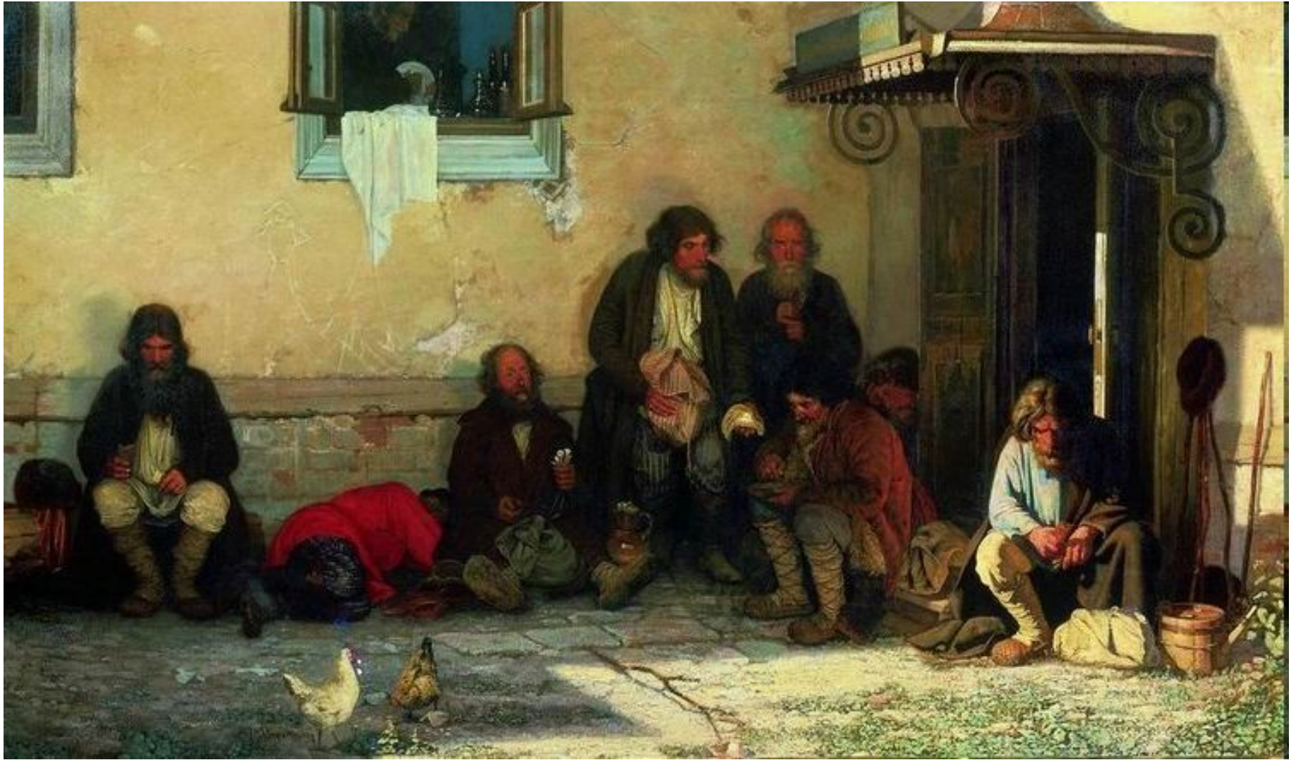
Григорий Мясоедов. Земство обедает, 1872