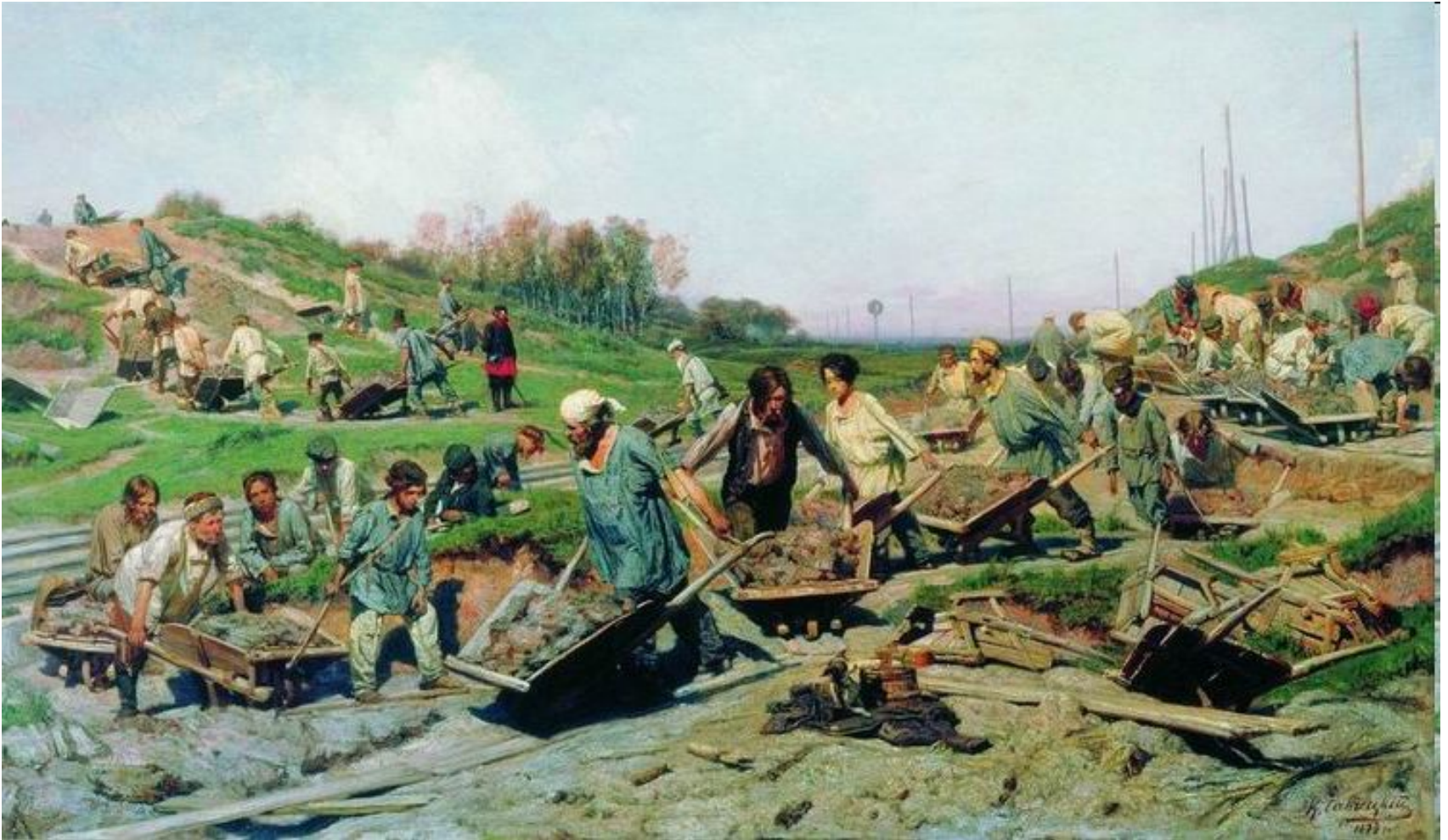
Ремонтные работы на железной дороге, 1874