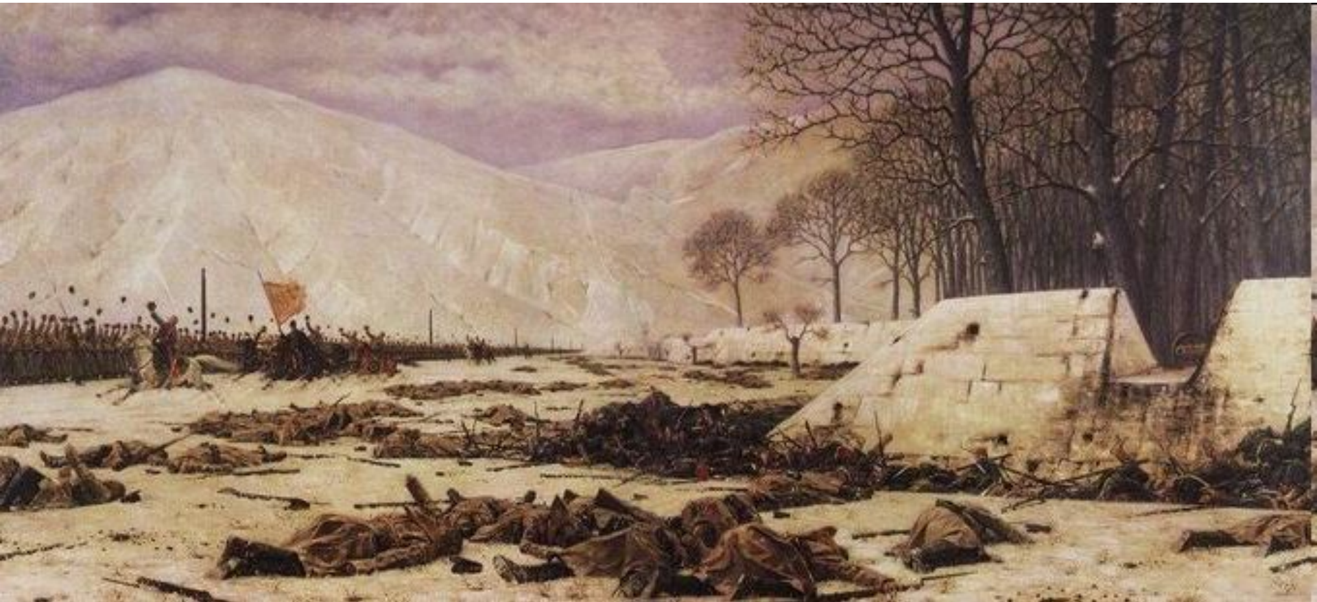
«Скобелев под Шипкой»

Балканская серия создавалась в Париже в 1878-1879 годах (отдельные полотна написаны позднее) на основе этюдов и коллекции подлинных предметов, привезенных из Болгарии.