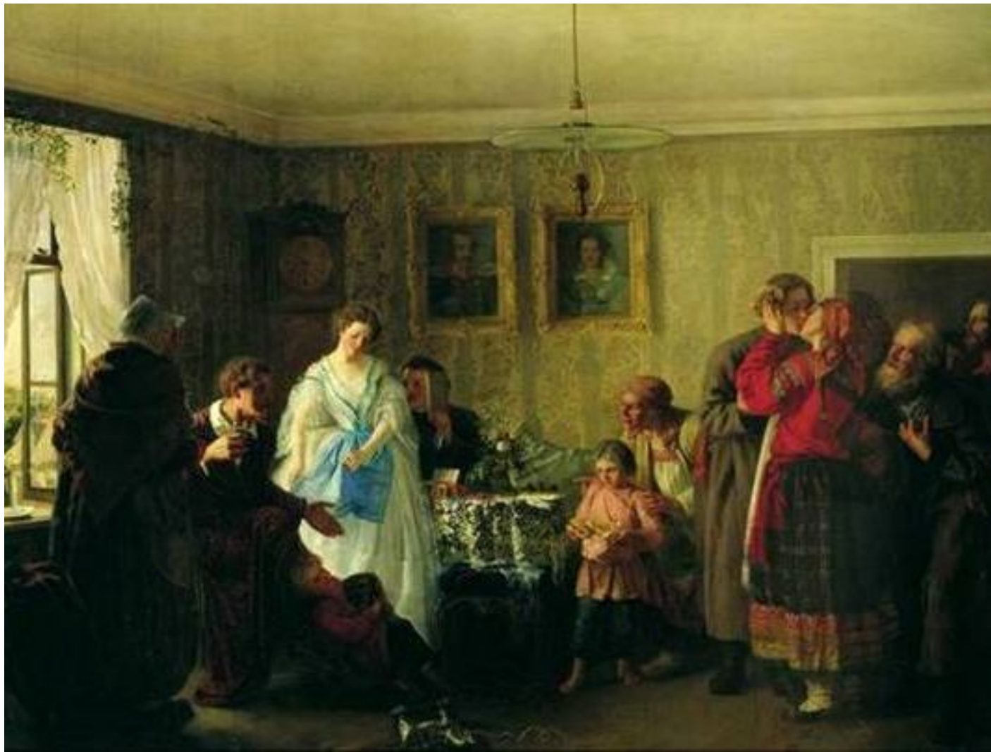
Григорий Мясоедов. Поздравление молодых в доме помещика