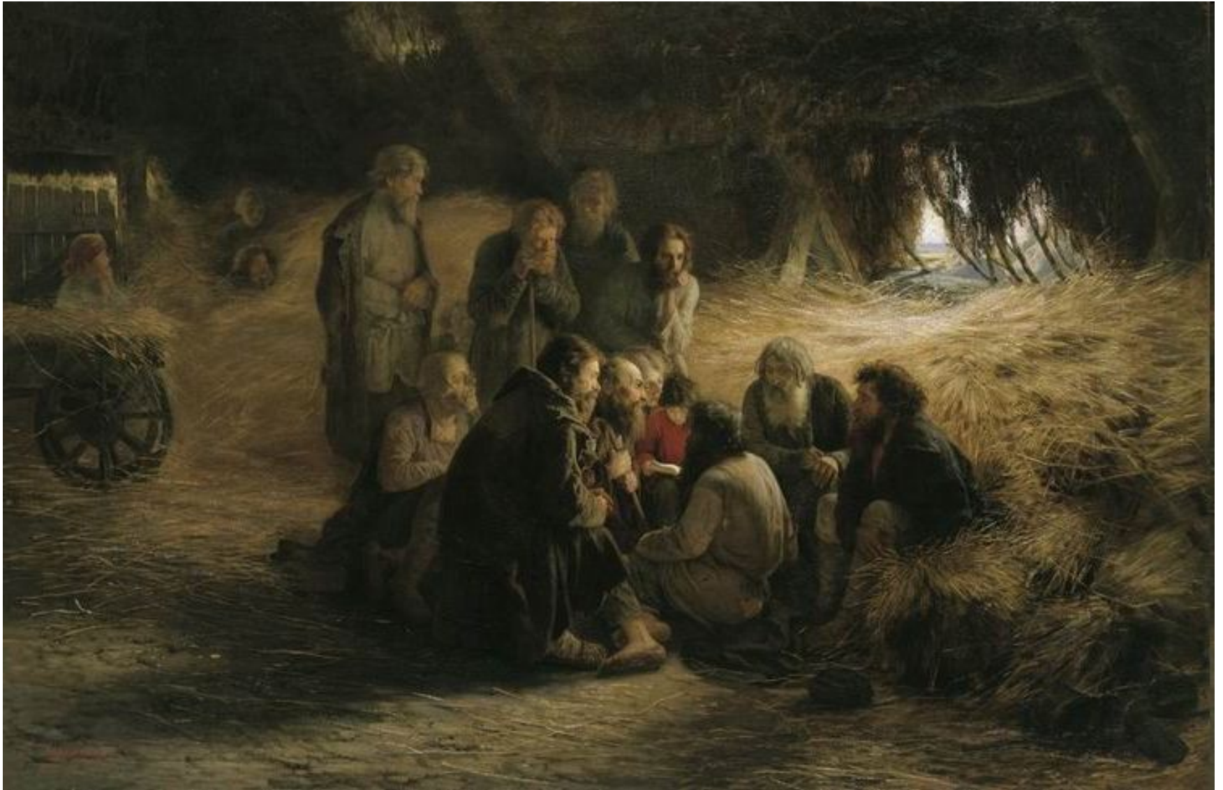
Григорий Мясоедов. Чтение Положения 19 февраля 1861 года, 1873