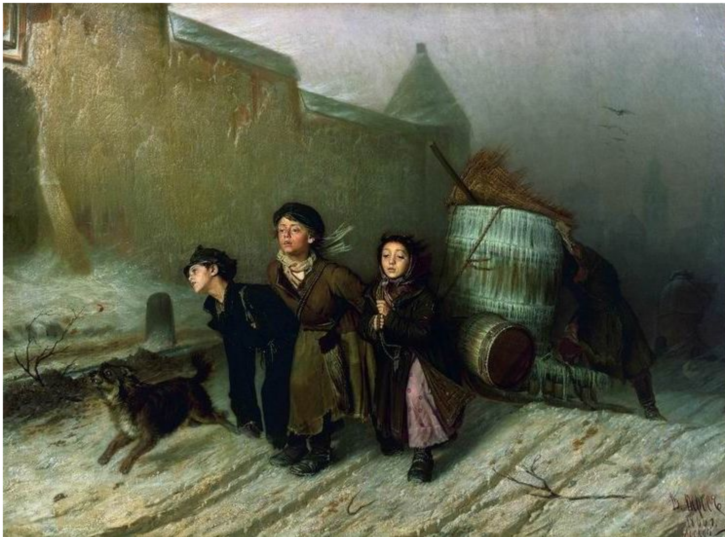
Василий Перов. Тройка. Ученики мастеровые везут воду, 1866