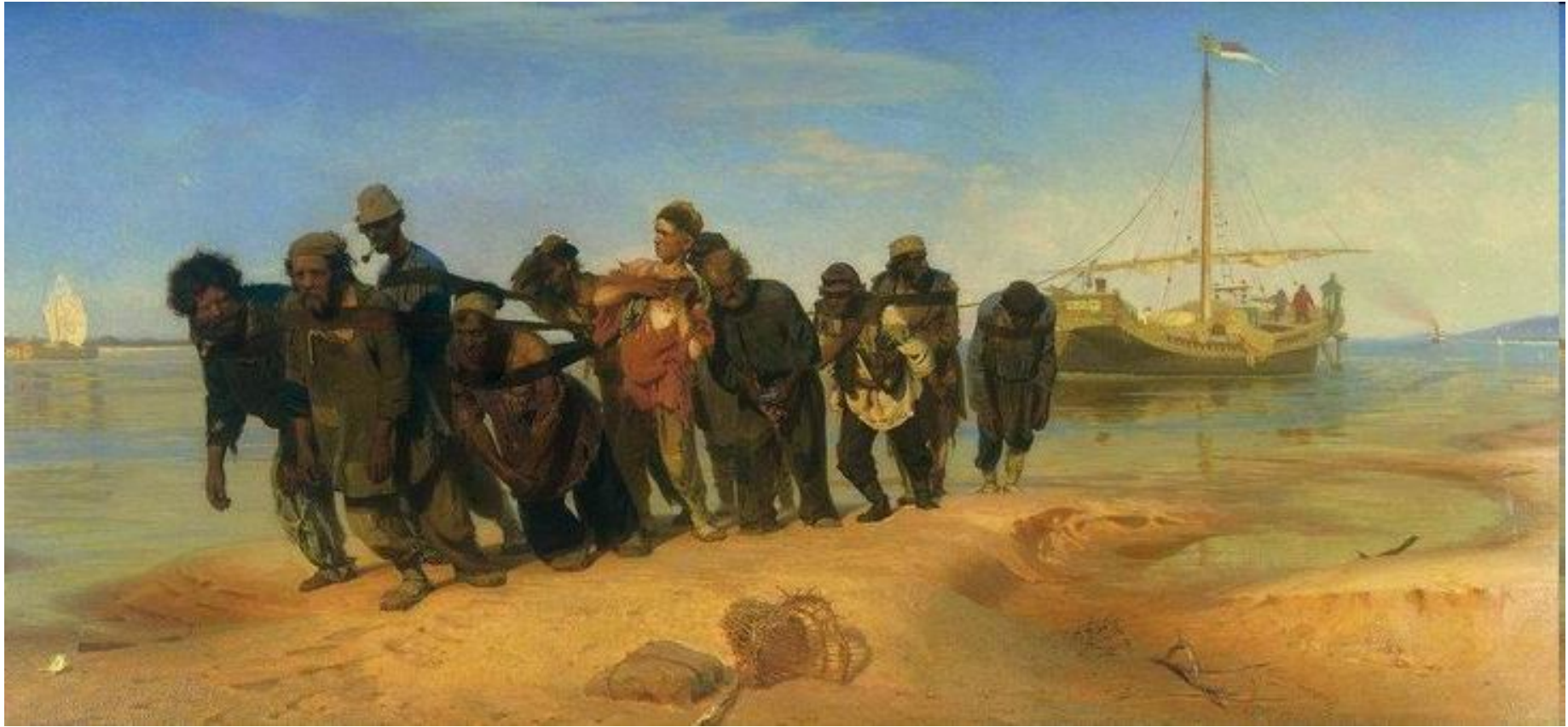
Репин И.Е. Бурлаки на Волге, 1870-1873