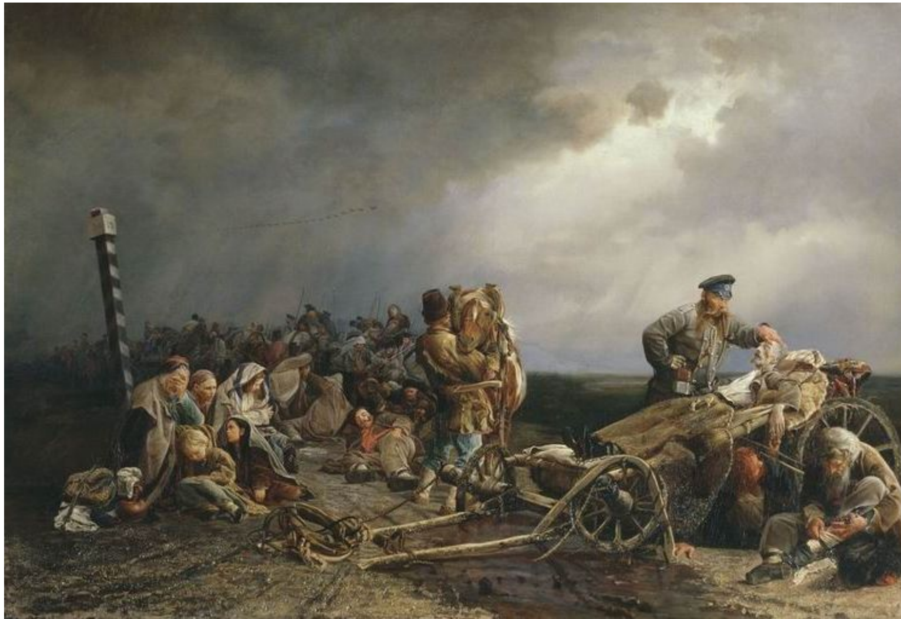
Валерий Якоби - Привал арестантов, 1861