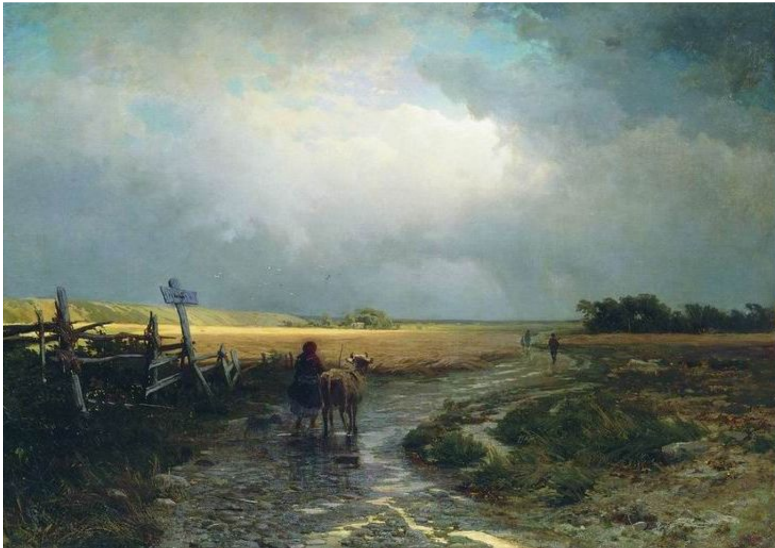
Федор Васильев. После дождя. Проселок. 1867-1869