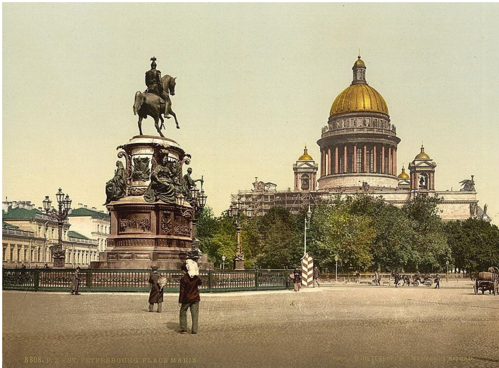
Памятник Николаю I