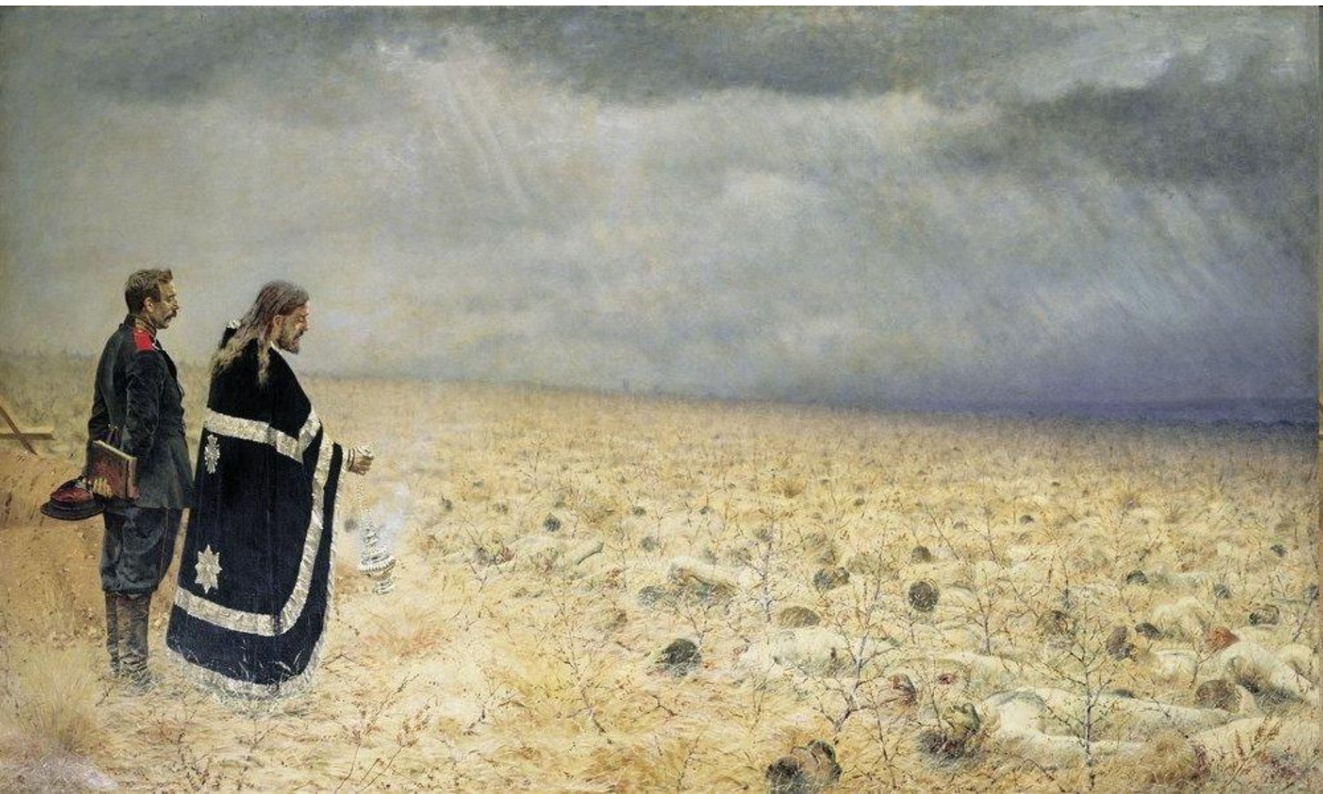
«Побежденные. Панихида по павшим воинам»