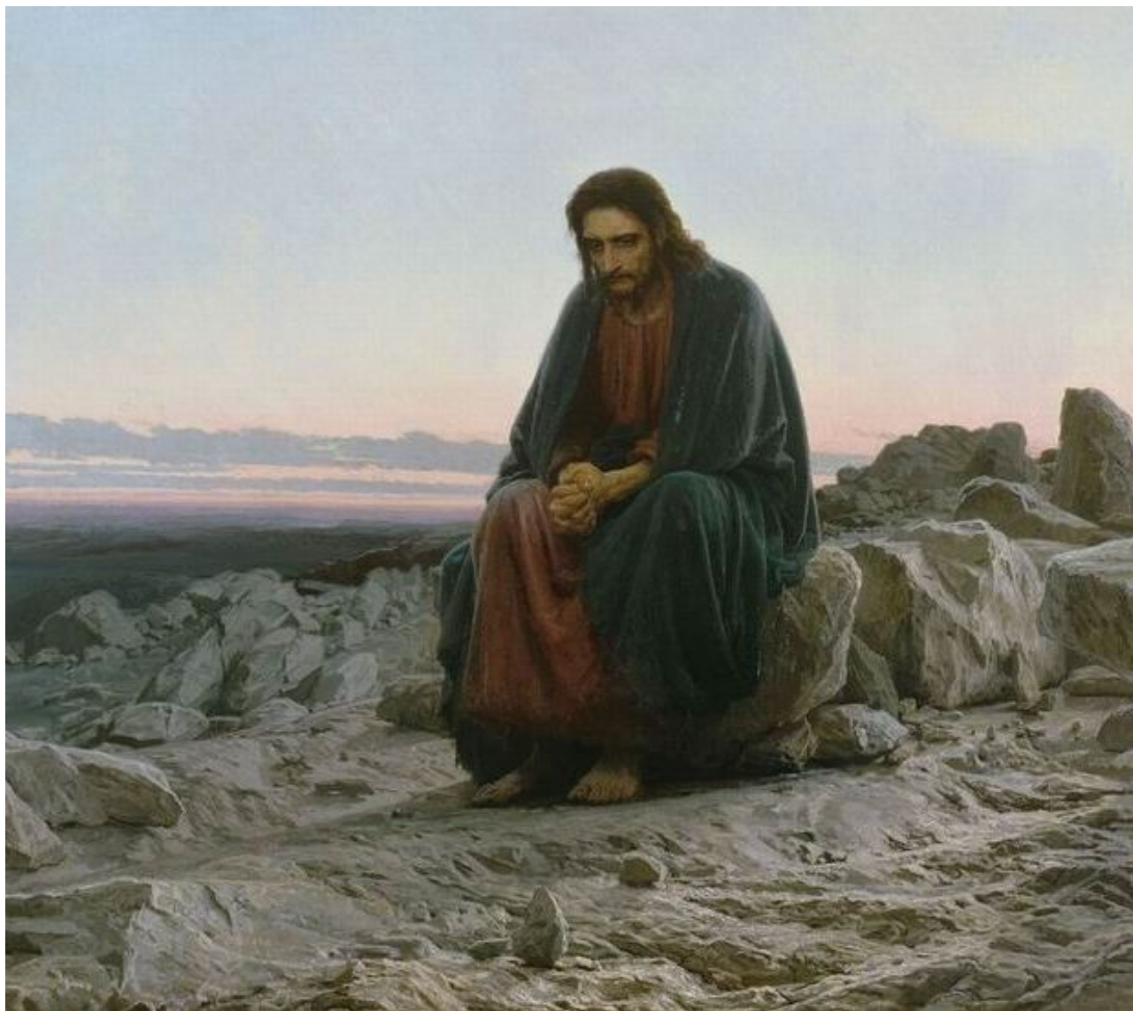
Иван Крамской. Христос в пустыне, 1872