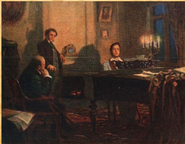
А.С.Пушкин и В.А.Жуковский в гостях у М.И.Глинки

Заметное место в творчестве композитора занимает камерно-вокальная музыка (инструментальная). 80 романсов и песен были созданы им на стихи А.С.Пушкина, В.А.Жуковского и М.Ю. Лермонтова. Кроме того, он знакомится с другими композиторами, и все время совершенствует свой стиль. Весной 1830 года юноша едет в Италию, немного задержавшись в Германии. Он пробует свои силы в жанре итальянской оперы, а его композиции становятся более зрелыми.