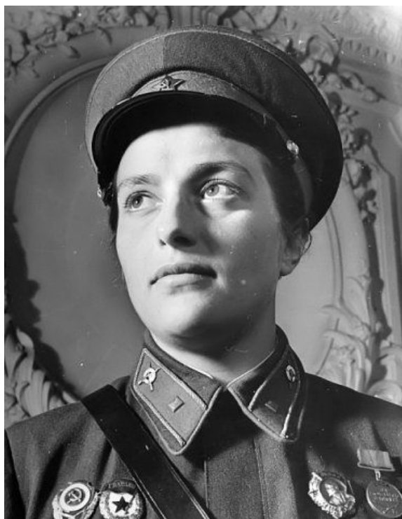
Герой Советского Союза, Людмила Михайловна Павличенко.

Снайпер 54-го стрелкового полка 25-й стрелковой дивизии Приморской армии Северо-Кавказского фронта младший лейтенант Л.М. Павличенко. 1942г. С июля 1941г. по июль 1942г. (до получения тяжёлого ранения) уничтожила 309 фашистов, из них 36 снайперов.