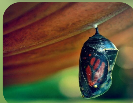
Вихід метелика Cethosia biblis з лялечки

З незапам'ятних часів метелики асоціюються з весною, красою, вічністю. Вони були символом безсмертності, щастя, вірності, любові.