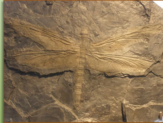
Велетенська викопна бабка Меґаневра Монія жила у кам'яновугільний період - 300 млн. років тому і мала розмах крил 70 см!

*У будові всього тіла стрекози багато цікавого, але разюча конструкція їх великих, що складаються з фасет, очей. Кожен з них містить 30 тисяч фасеток — це свого роду рекорд світу комах. Фасетки мають спеціалізацію — нижні здатні розрізнити тільки кольори, при цьому верхні визначають форму. З їх допомогою бабки впевнено орієнтуються в навколишньому просторі.