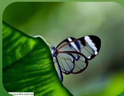
«Прозорий» метелик Greta oto