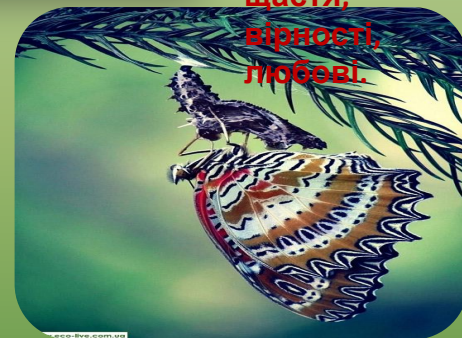
Вихід метелика Cethosia biblis з лялечки