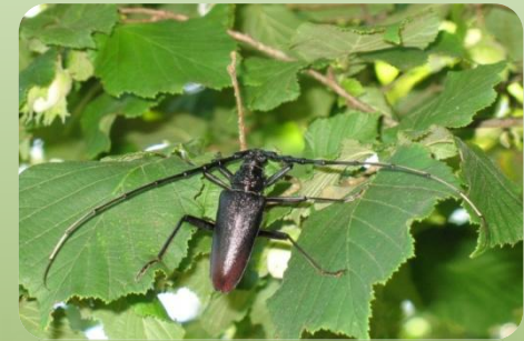
Усач великий дубовий

Зустрічається по всій Європі і на Кавказі. На території України мешкають у західних, центральних областях, невеликі популяції зустрічаються в Криму та сході.