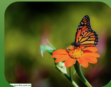
Метелик Danaus plexippus