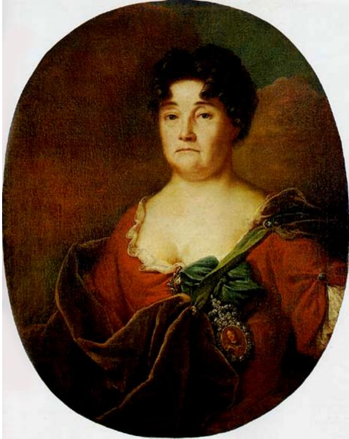
Портрет А. П. Голицыной 1728г.