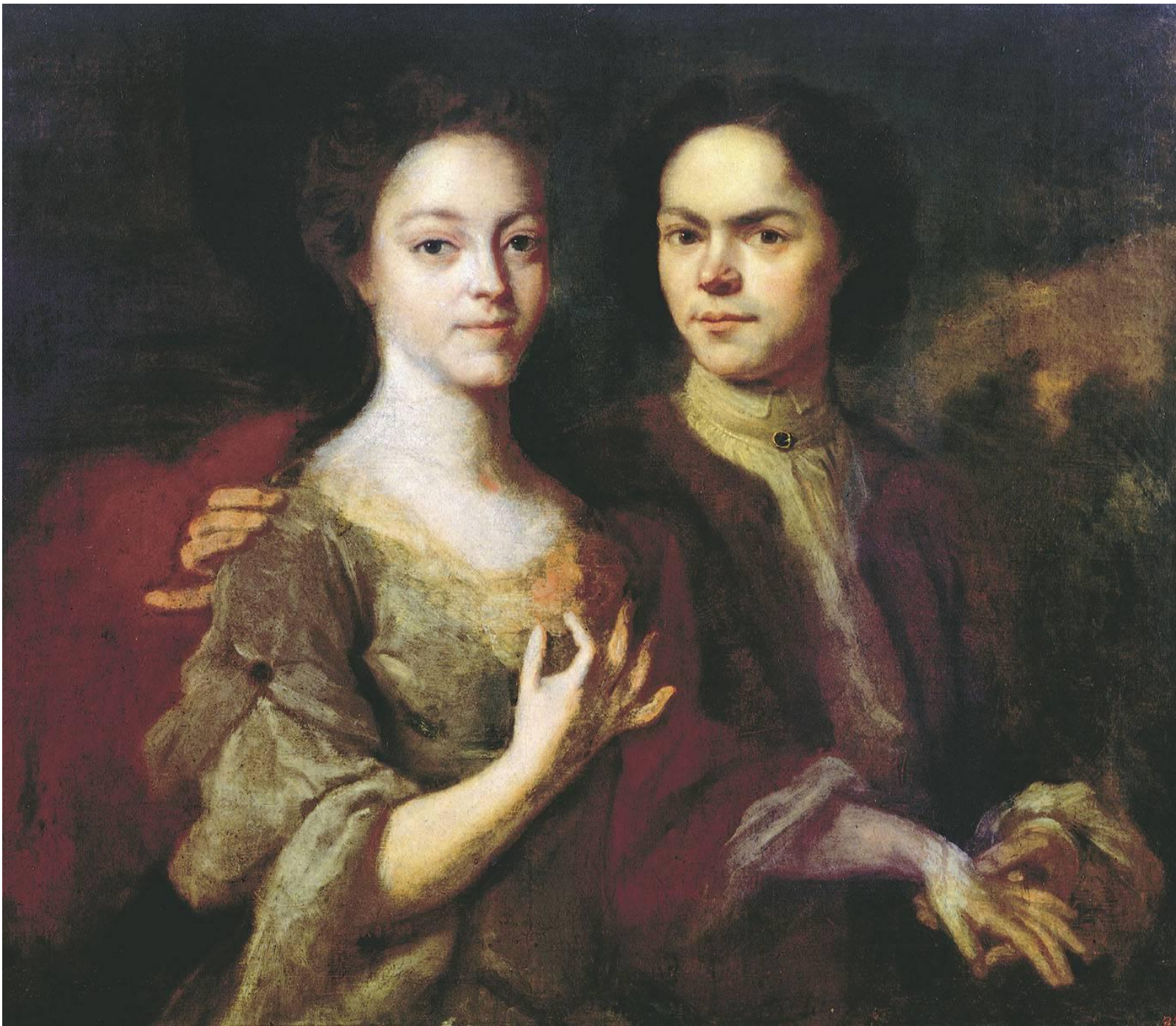
Автопортрет с женой 1729?