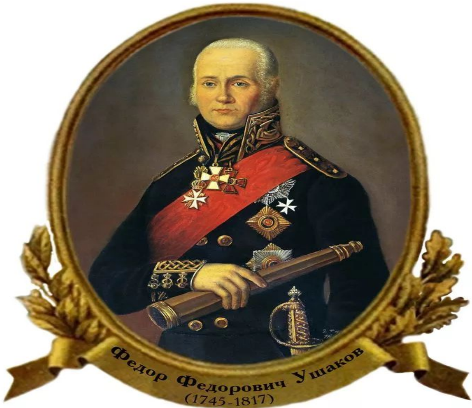
Федор Федорович Ушаков (1745-1817)