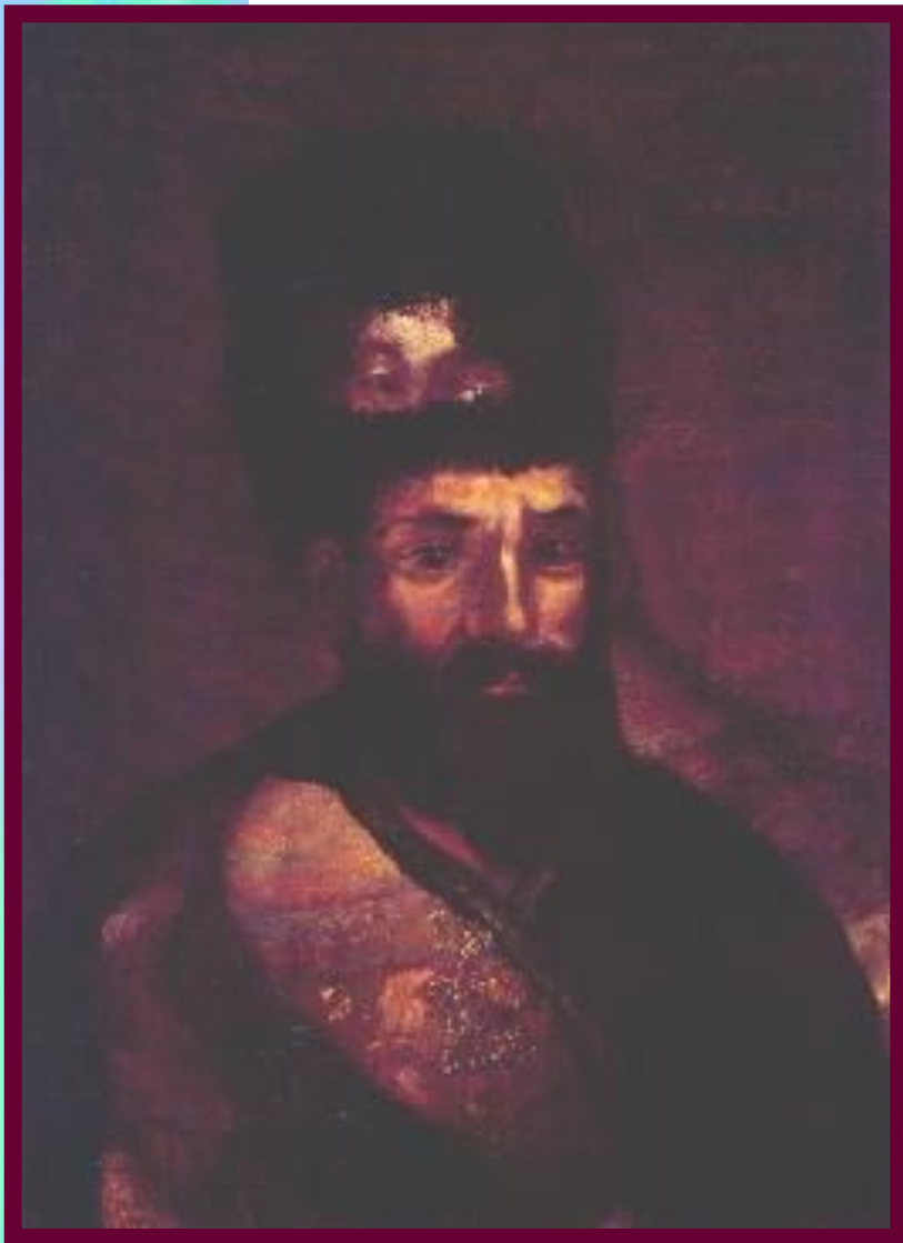
Портрет Пугачева на фоне Портрета Екатерины II.

Е.И.Пугачев родился на Дону. Во время Семилетней войны он дослужился до чина хорунжего. В 1771 г. дезертировал из армии и в 1773 г. появился на р.Яик и объявил себя «чудесно спасшимся» Петром III.