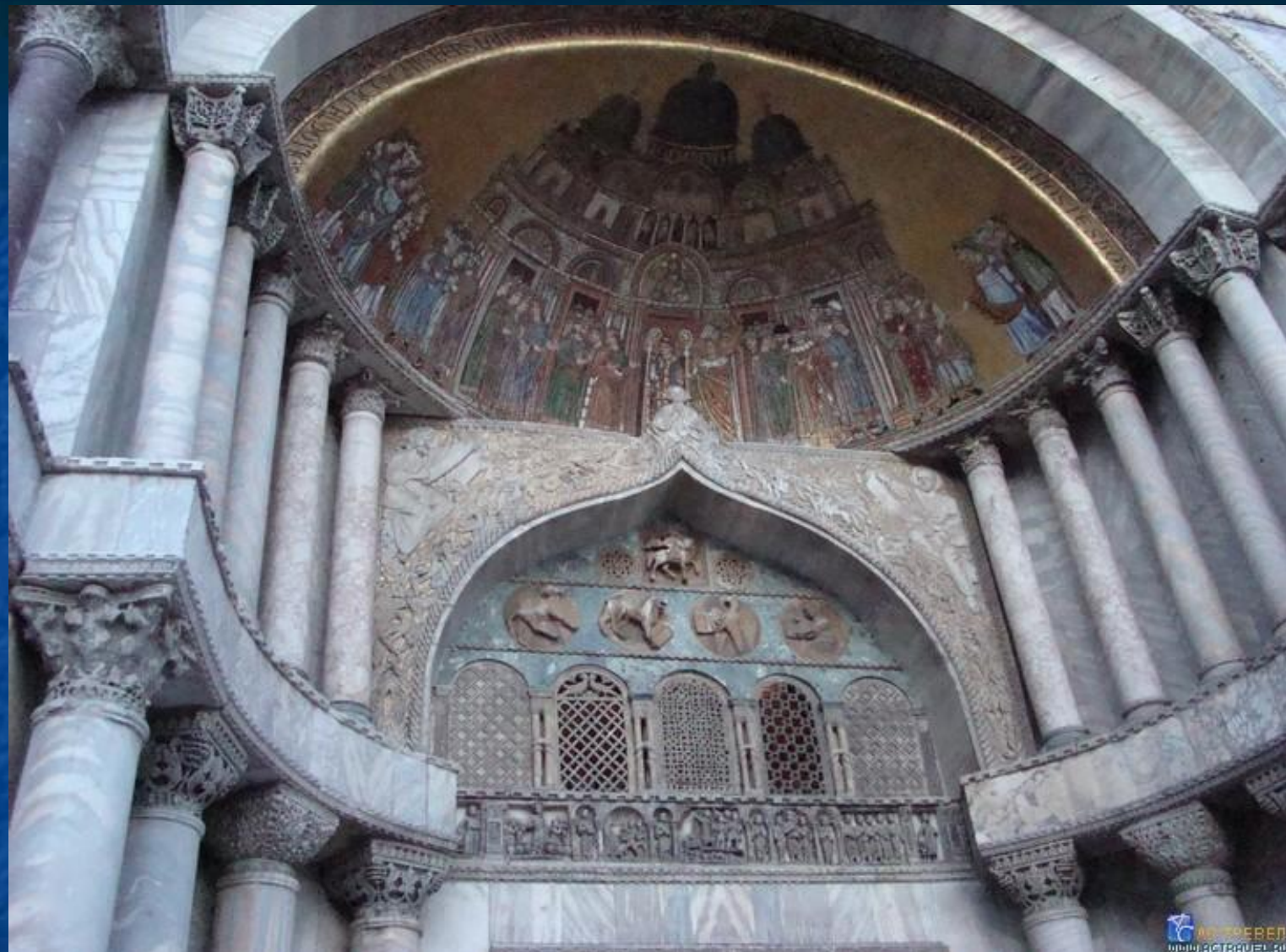
Старейшая из мозаик фасада венецианской базилики Святого Марка.