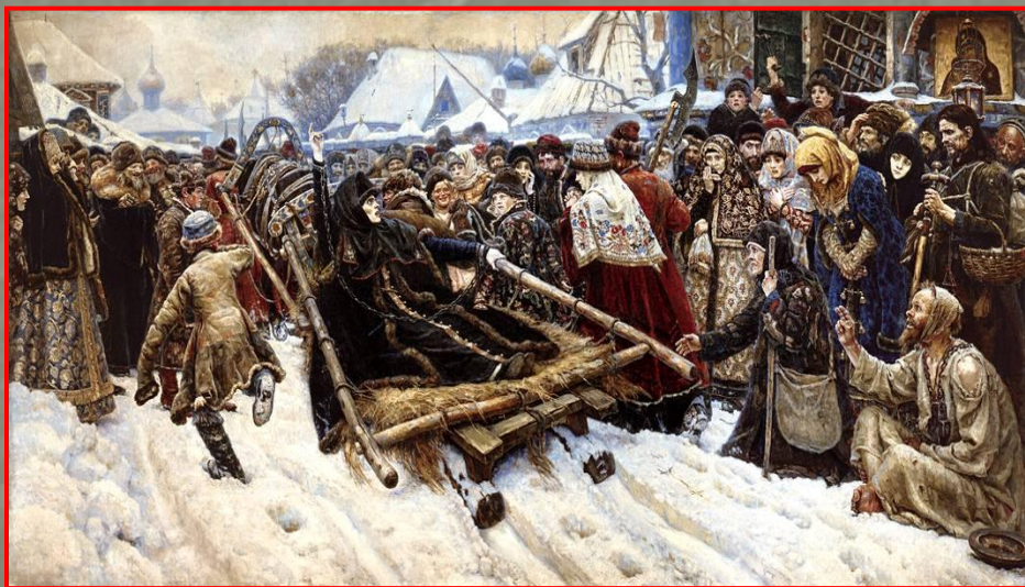
В.Суриков «Боярыня Морозова»

жанр изобразительного искусства, посвященный историческим событиям и деятелям, а также социально значимым явлениям в истории общества.