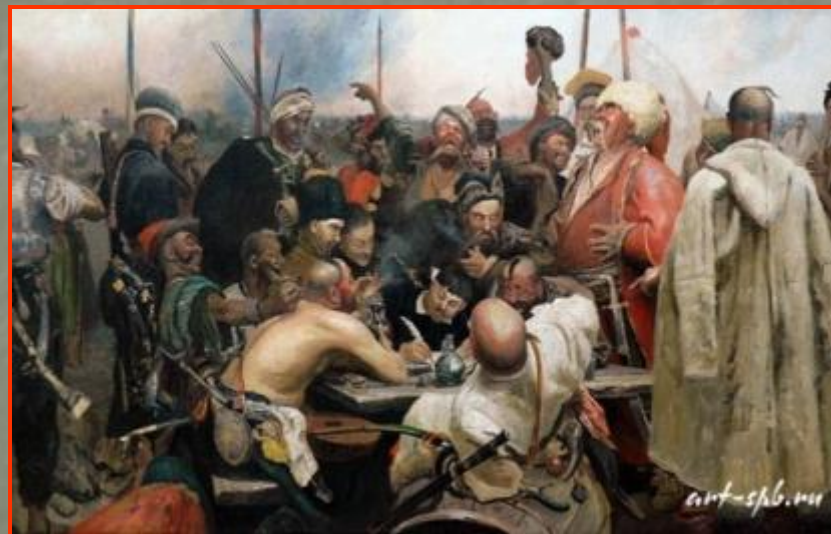
И.Репин «Запорожцы пишут письмо турецкому султану»