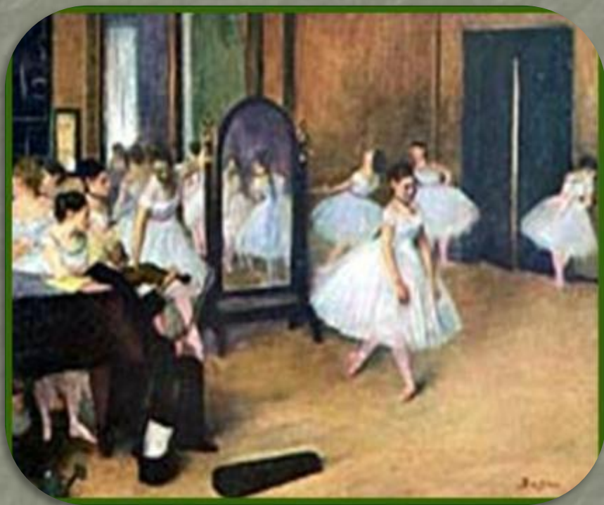
Эдгар Дега «Танцевальный класс»