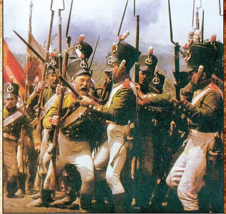
Кадр из фильма «Война и мир». Бородинское сражение

Во время войны герои романа, отбросив все личное, становятся единым целым с народом: Андрей чувствует необыкновенный подъем перед Бородинским сражением; все мысли Пьера направлены на то, чтобы помочь изгнанию захватчиков; Наташа отдает подводы раненым (был выбор думать о себе или о других и она пожертвовало имуществом которое можно было вывести из дома, ради спасения раненых, чтобы их побыстрее отвезли в госпиталь); Петя Ростов погибает в схватке с врагом.