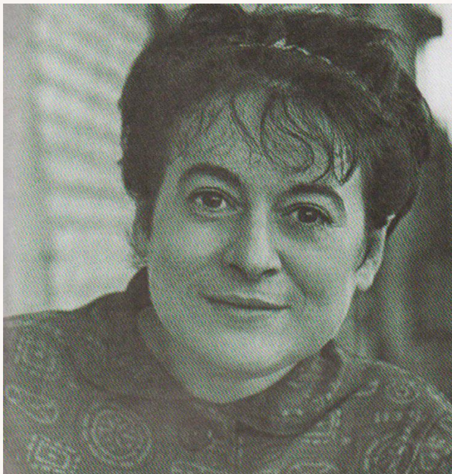
Эмма Эфраимовна Мошковская (1926-1981)