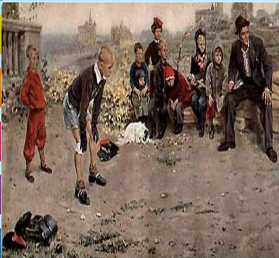
С.А. Григорьев «Вратарь» 1949 г.