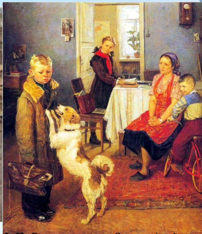
Ф.П. Решетников «Опять двойка» 1952 г.