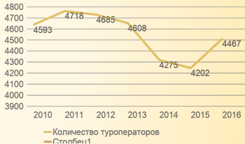
Кол-во туроператоров в РФ с 2010 по 2016 гг.