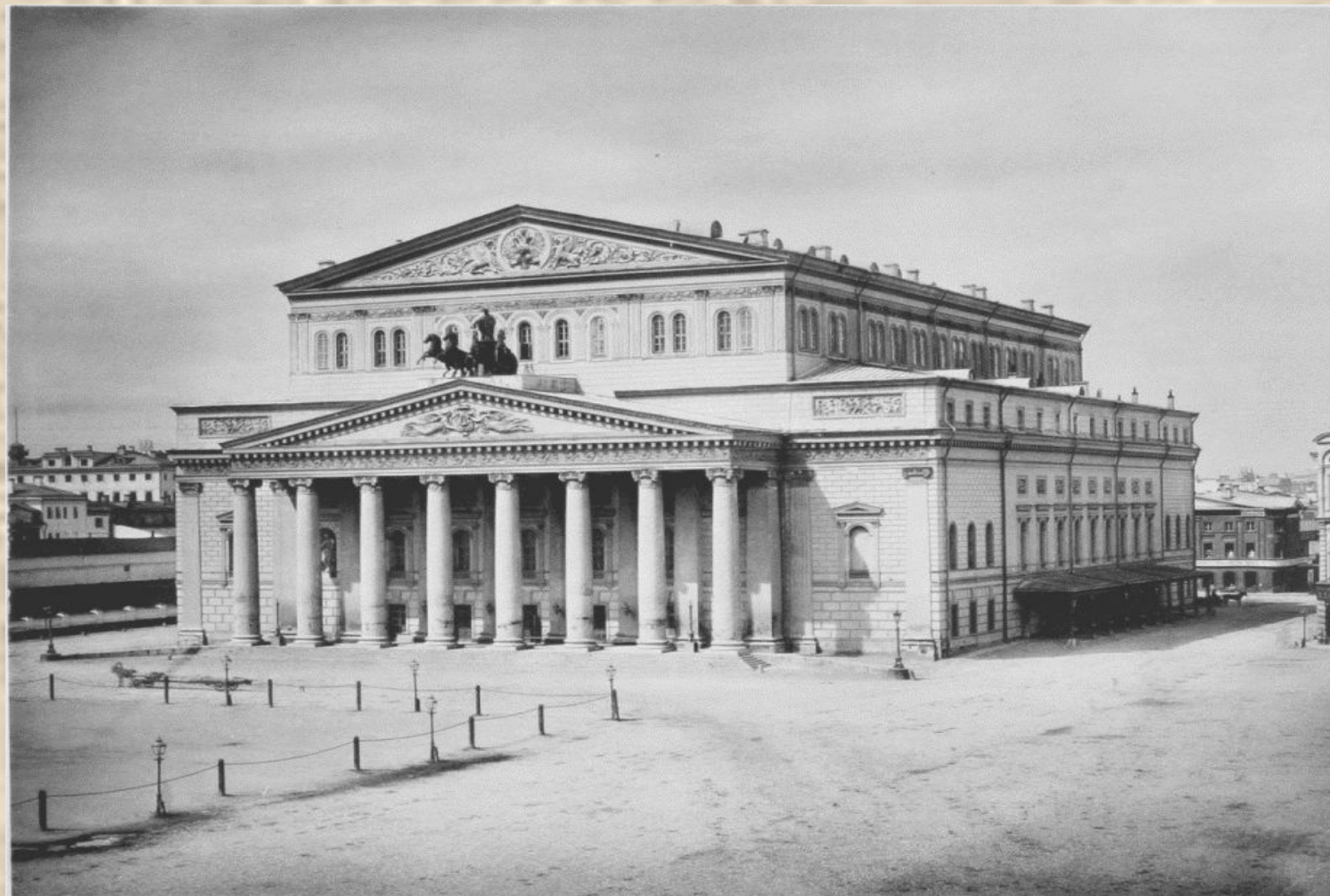
Большой театр в Москве (основан в 1776г.)