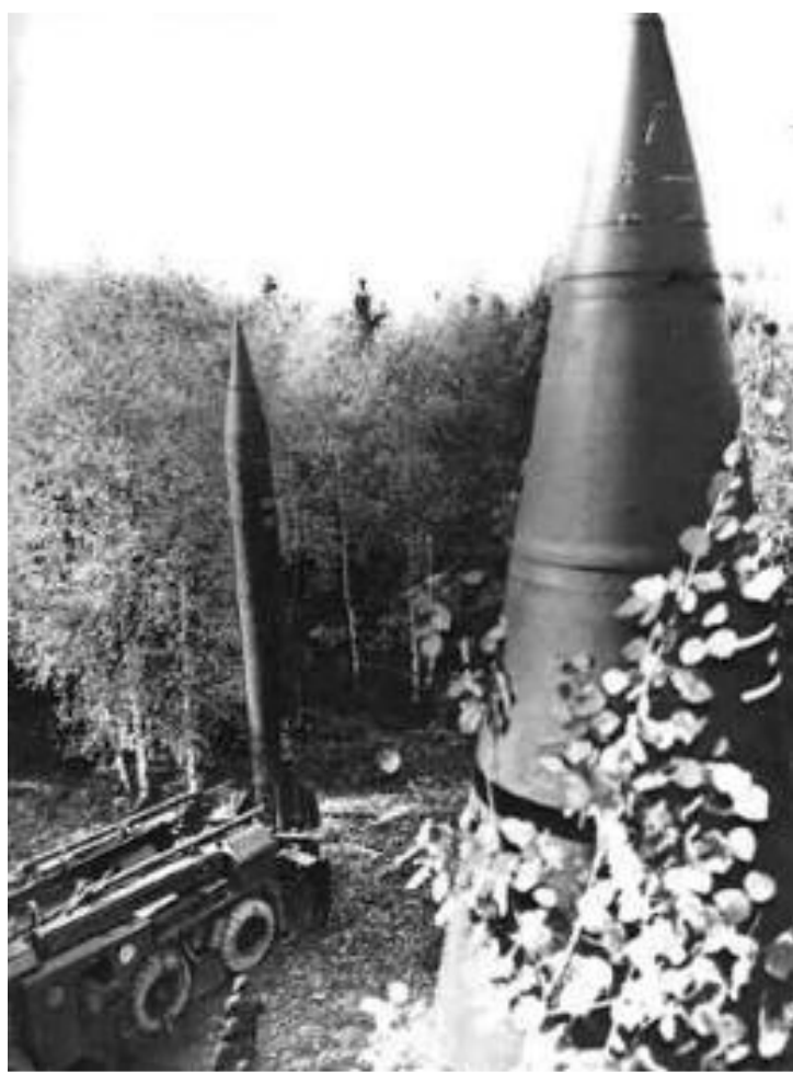
Ракеты средней дальности.

В сер.60-х гг.руководство страны поставило задачу достичь военно-стратегического паритета с США.На вооружение начала поступать новейшие техника и ядерное оружие.Роль Генералитета и руководства ВПК резко выросла.В 1976 г. Министром обороны стал член Политбюро Д. Ф. Устинов,возглавлявший долгие годы различные отрасли военного производства.