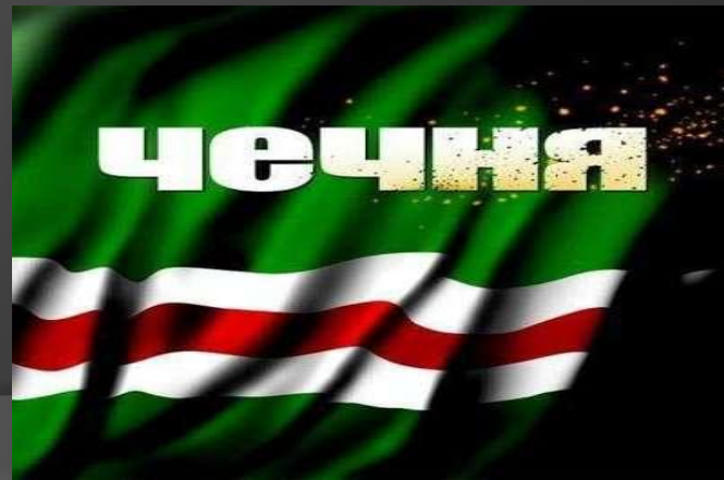
Флаг Чечни до 2004 года