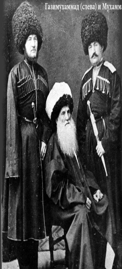
Имам Дагестана и Чечни Шамиль вместе с сыновьями Газимухаммад (слева) и Мухаммадшафи (справа).

России После приема в Петербурге императором ему была отведена для жительства Калуга. В августе 1866 года в парадной зале Калужского губернского дворянского собрания Шамиль вместе с сыновьями Гази-Магомедом и Магомедом-Шапи принес присягу на верноподданство. России Спустя 3 года, Высочайшим Указом Шамиль был возведён в потомственное дворянство. В 1868 году зная, что Шамиль уже немолод и калужский климат не лучшим образом сказывается на его здоровье, император решил выбрать для него более подходящее место, каковым стал Киев. В 1870 году Александр II разрешил ему выехать в Мекку для паломничества. После совершения хаджа, Шамиль посетил Медину, где и скончался в феврале 1871 года. Похоронен в Медине на кладбище Аль-Бакия (ныне Саудовская Аравия