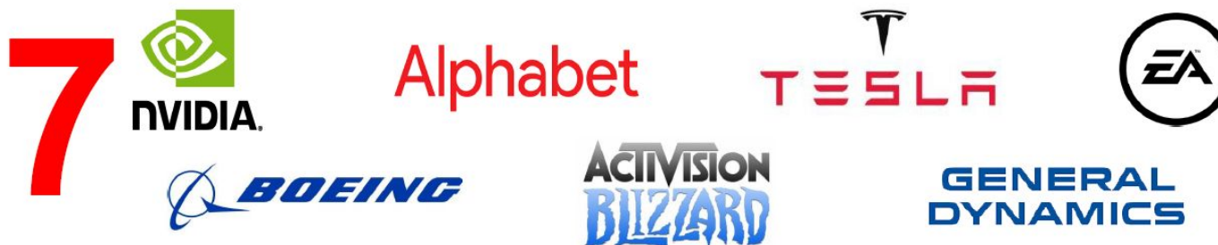
Статистика доходности корзины акций:

Доходная часть формируется из корзины 7 компаний работающих в сфере инноваций