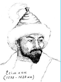
Есім хан (1598 - 1628 жж)