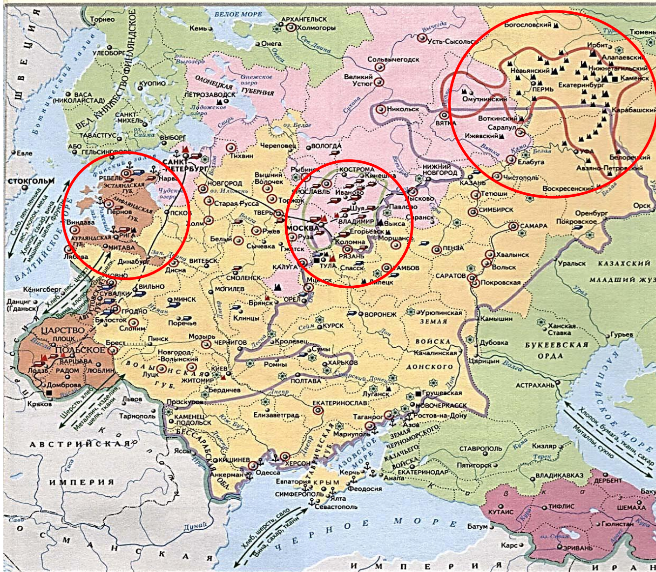
Районы сосредоточения предприятий (в 1850 г.)