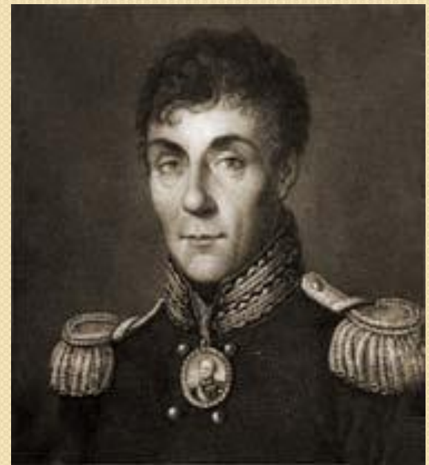
Алексей Андреевич Аракчеев