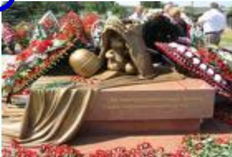
Памятник спецназовцам, погибшим при исполнении своего долга