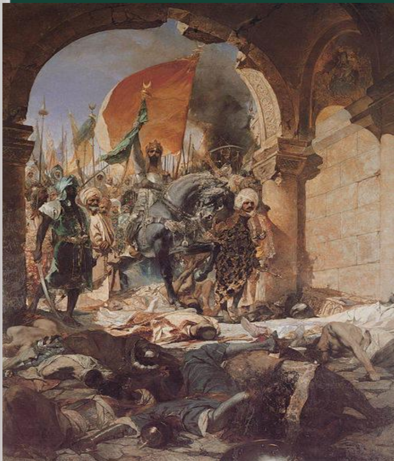
Мехмед II (1451—1481)

Со вступлением на престол Мехмеда II, турки-османы начали решительное наступление на Константинополь. Он был очень образованным, но это не мешало ему быть жестоким.