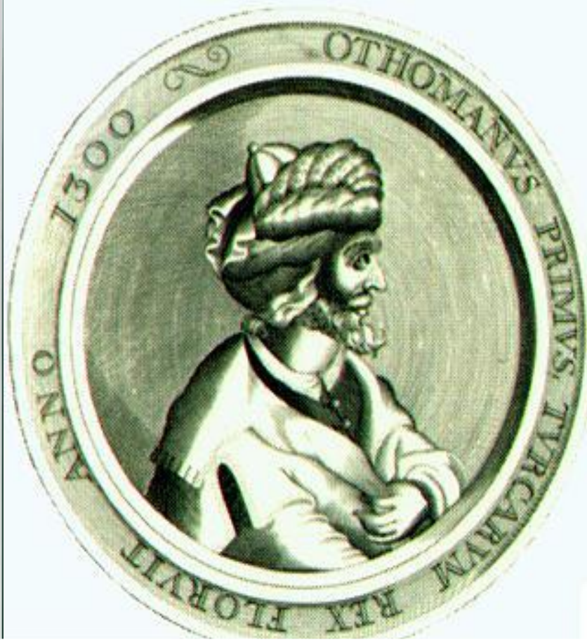
Осман I (1258-1324)

Одновременно с этими процессами в конце XIII века на северо-западе Малой Азии образовалось новое сильное государство - Османская империя . Она возникла на территории распавшегося государства турок-сельджуков. Свое название новая империя получила в честь своего основателя - Осман-бея.