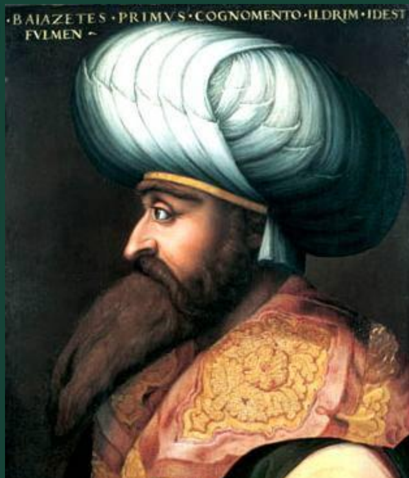
Султан Баязид I (1389— 1402)

Султан Баязид I, прозванный за быстроту Молнией, задумал завоевать Константинополь. Посторой большой флот, он перекрыл подвоз продовольствия в столицу империи.