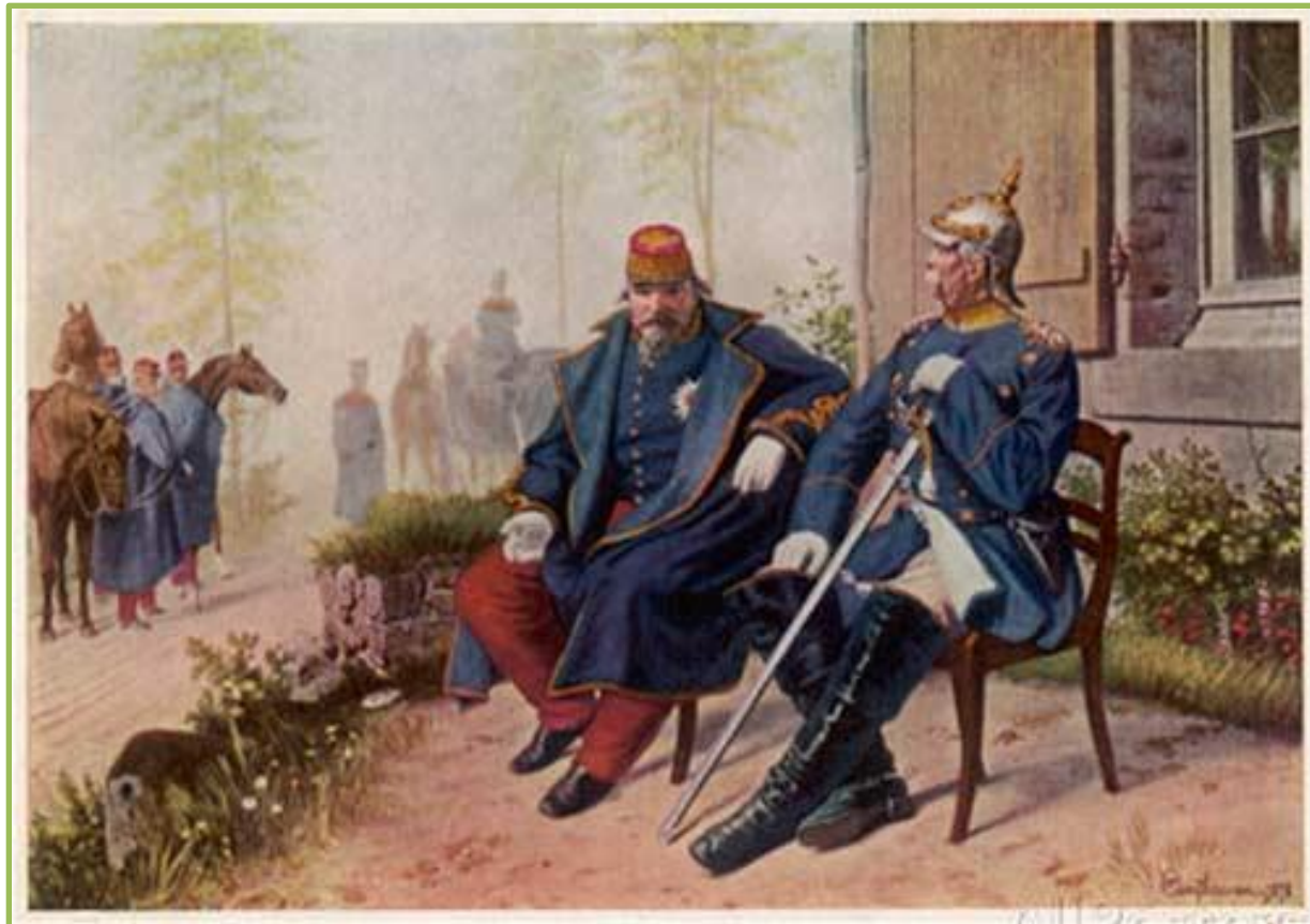
Наполеон III в плену у Бисмарка.