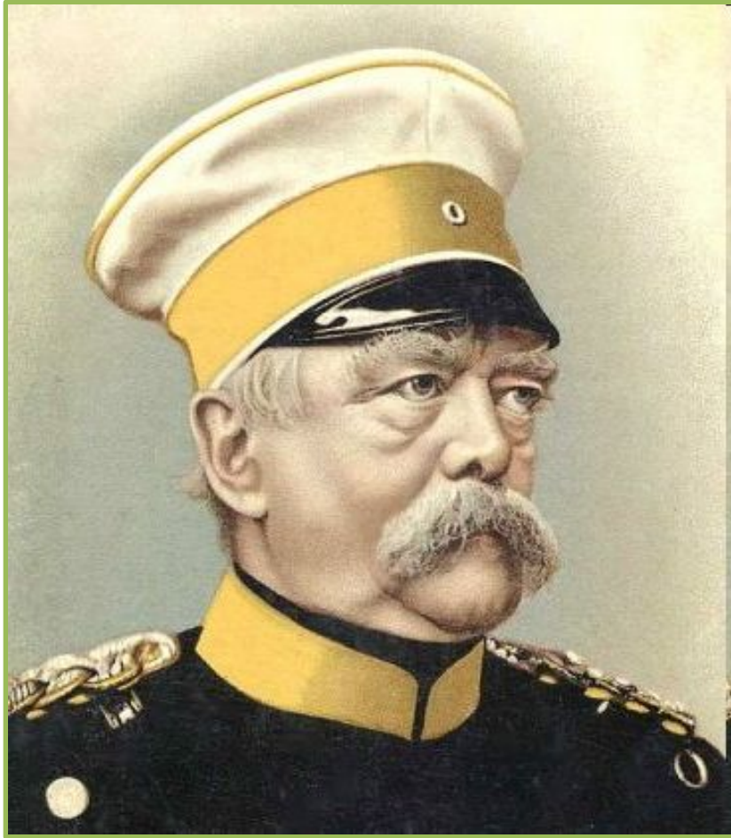
Канцлер Пруссии Отто фон Бисмарк

Бисмарк , считал с 1866 г. войну с Францией неизбежной и искал повод. Но, будучи опытным дипломатом, прусский канцлер хотел, чтобы Франция первая развязала войну, так как ее нападение должно было вызвать общенациональное демократическое движение за ускорение полного объединения Германии: южные немецкие государства могли добровольно встать под прусские знамена.