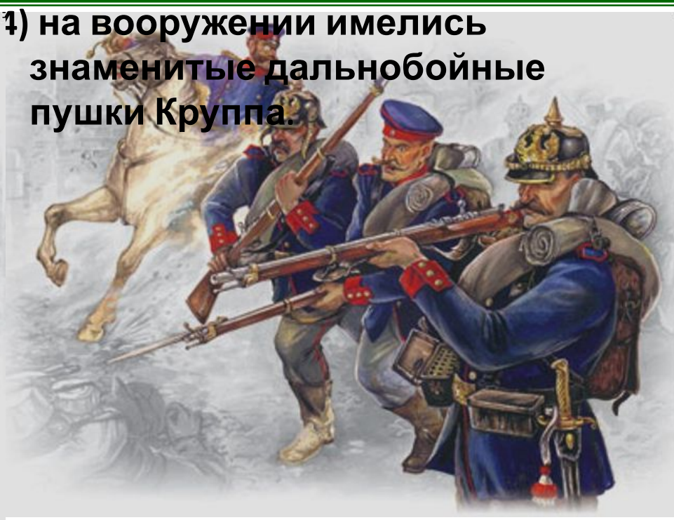
Прусская линейная пехота