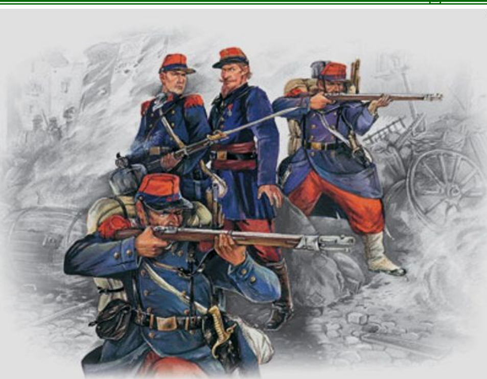
Французская линейная пехота