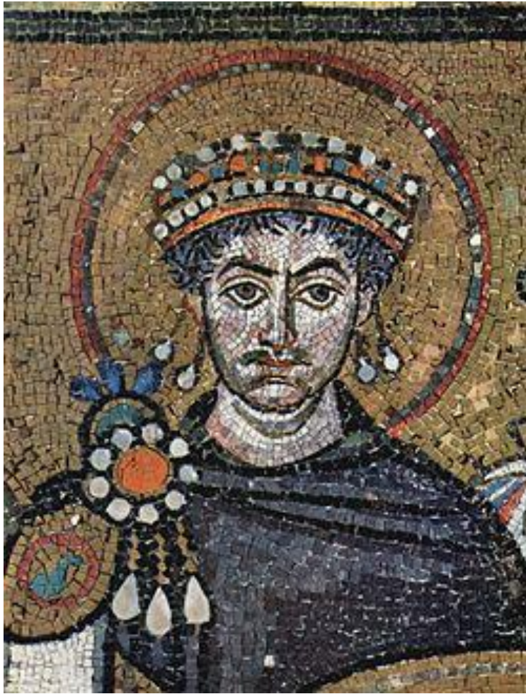
Юстиниан в старости

Юстиниан получил власть в очень трудное время: от бывших владений осталась малая часть, в церкви начались разногласия, местная знать чинила произвол, крестьяне разбегались, в городах проходили бунты, наметился финансовый кризис.