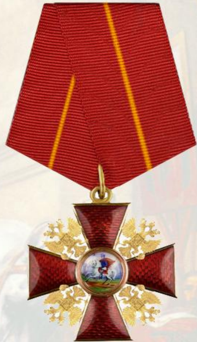
Орден Александра Невского