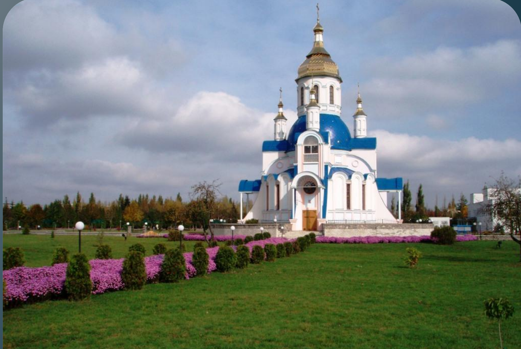
Церква великомучениці Валентини