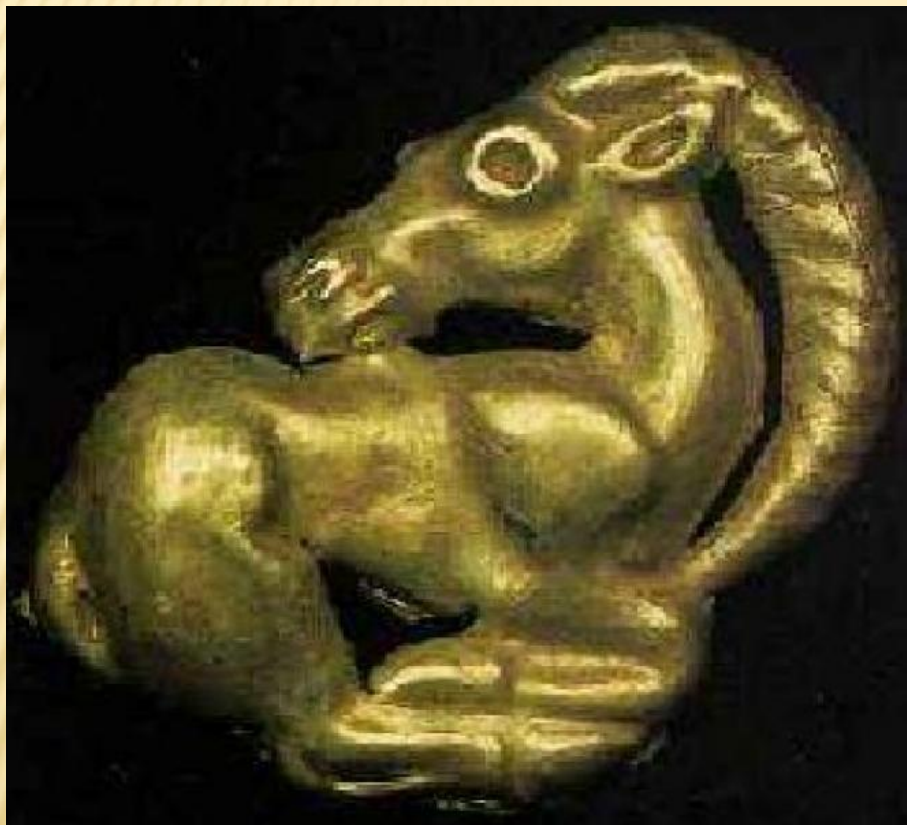
ЗОЛОТАЯ БЛЯШКА С ИЗОБРАЖЕНИЕМ КОЗЛА