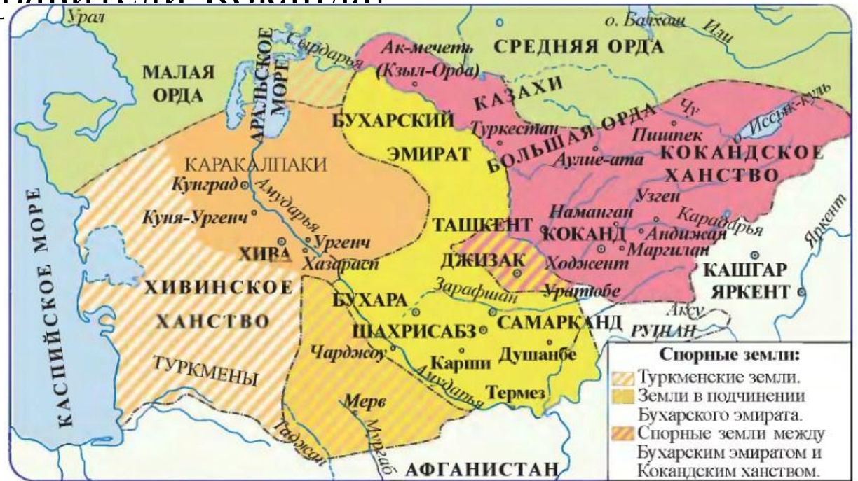
Карта государств Средней Азии в середине XIX века