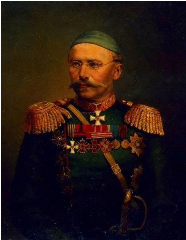
К. П. фон Кауфман

Отрезанный от Бухары, Худоярхан принял (1868 г.) предложенный ему генерал-адъютантом фон-Кауфманом торговый договор, в силу которого русские в К. ханстве и кокандцы в русских владениях приобретали право свободного пребывания и проезда, устройства караван-сараяв, содержания торговых агентств (караван-баши), пошлины же могли быть взимаемы в размере