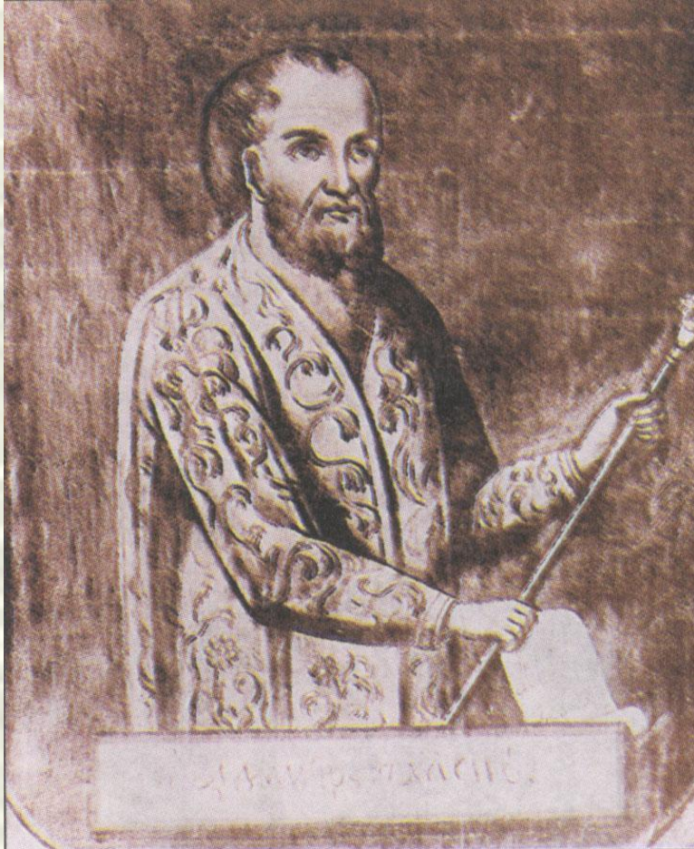
Князь Дм. Михайлович Пожарский