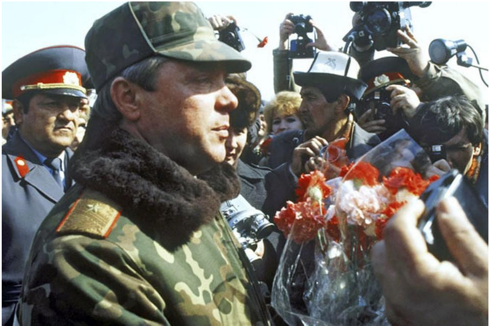
Генерал-полковник Борис Громов: "Мы ушли из..."