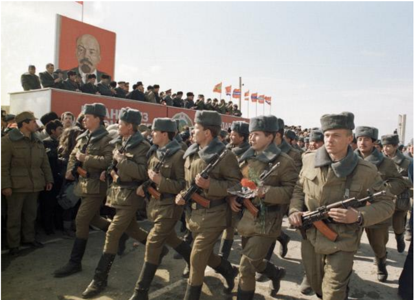
ТЕРМЕЗ ПАРАД ВЫВОД ВОЙСК АФГАНИСТАН