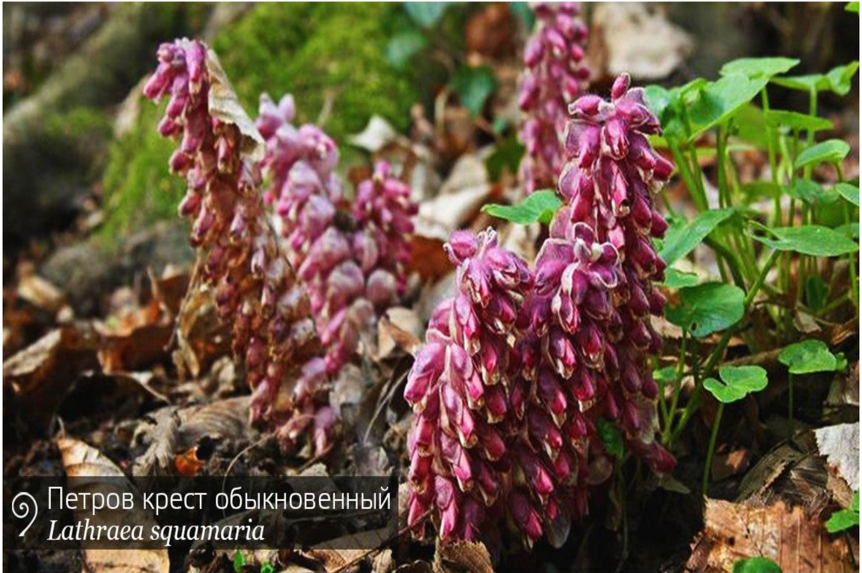
Петров крест обыкновенный Lathraea squamaria