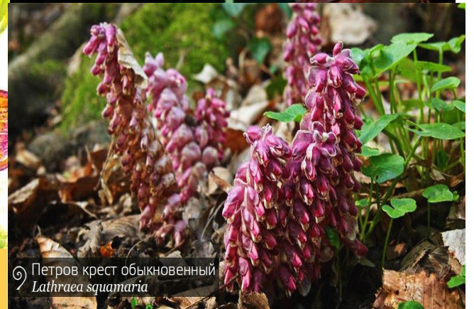
Петров крест обыкновенный Lathraea squamaria