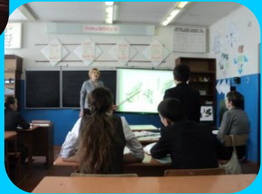
Фото 2. Учебный диалог на уроке