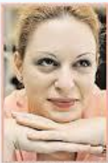
Красуется, хочет понравиться.