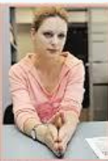
Внимательно слушает, интерес.