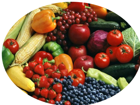
Фрукты, овощи (славятся дыни и виноград)