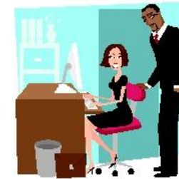
Зарплата, гонорар или прибыль