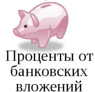
Проценты от банковских вложений