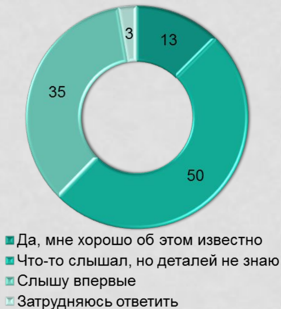
Диаграмма 2. Знаете ли Вы об этом? (в % от всех опрошенных)