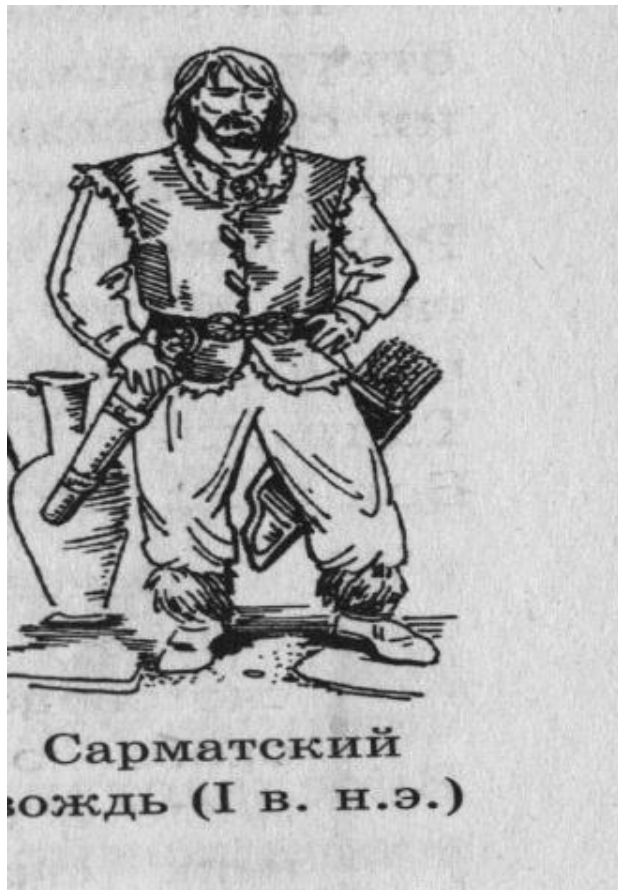
Сарматский вождь (I в. н.э.)