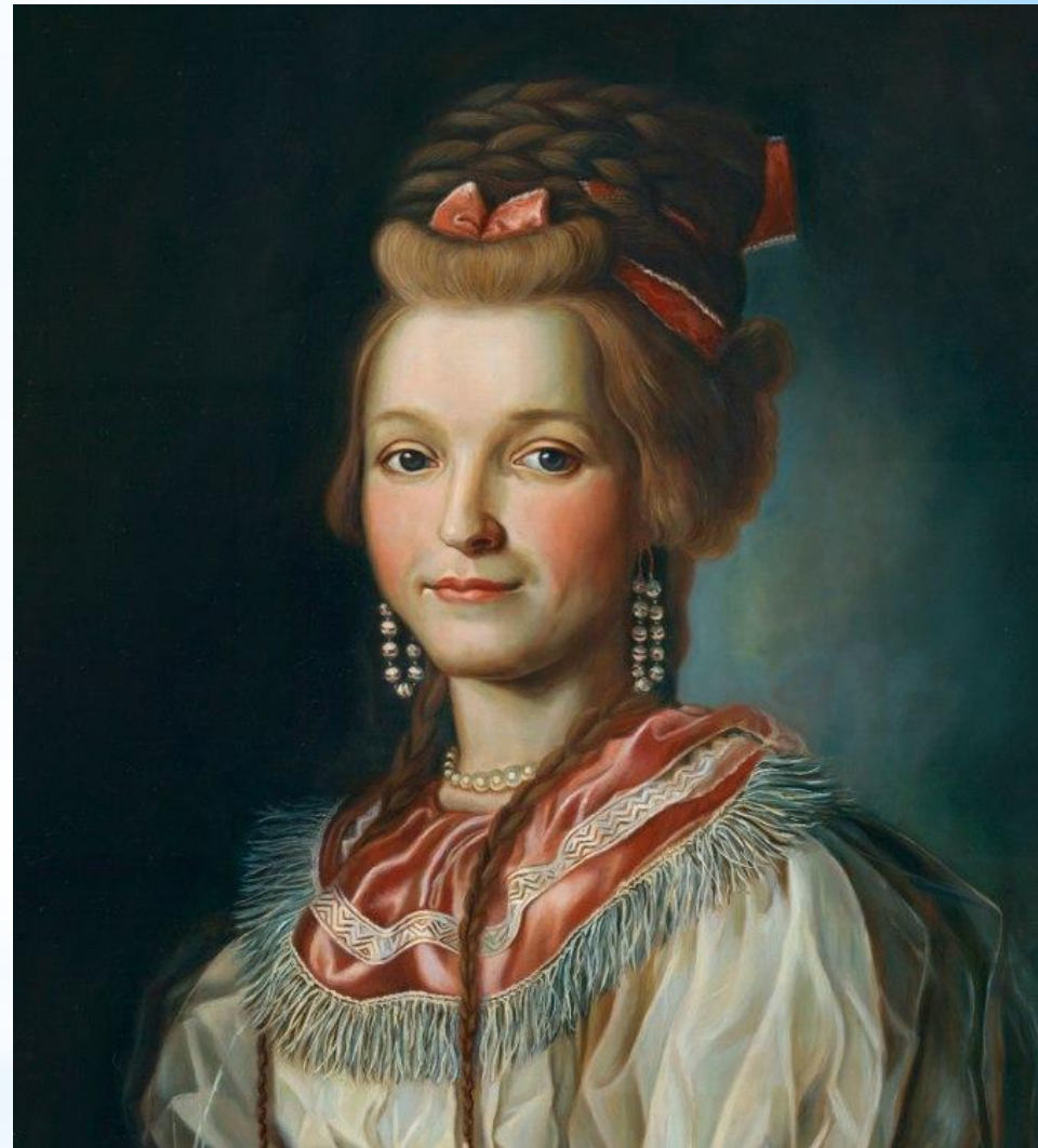
Портрет актрисы Т.В. Шлыковой-Гранатовой