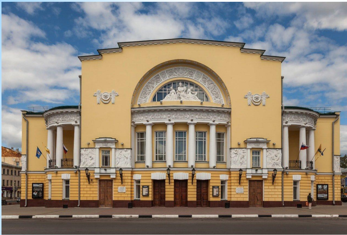
Театр им. Ф.Г. Волкова в Санкт-Петербурге