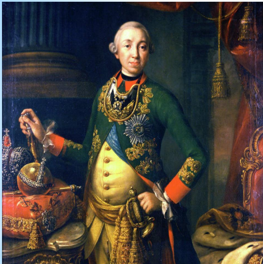
А.П. Антропов. Портреты императора Петра III