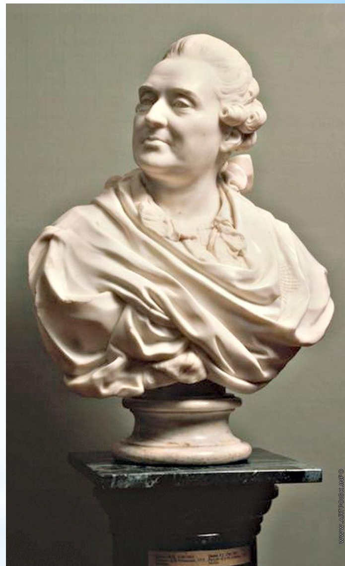
Ф.И. Шубин. Скульптурный портрет А.М. Голицына