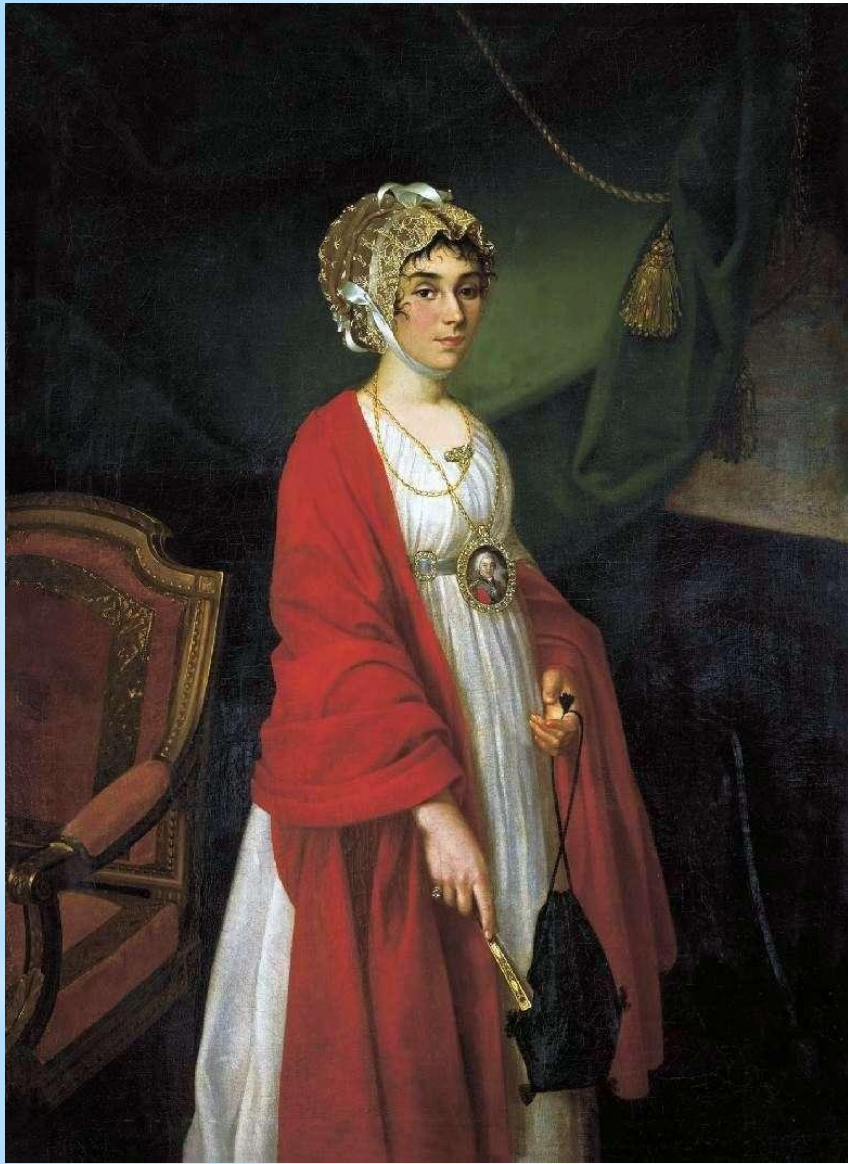
Портрет актрисы П. И. Ковалевой